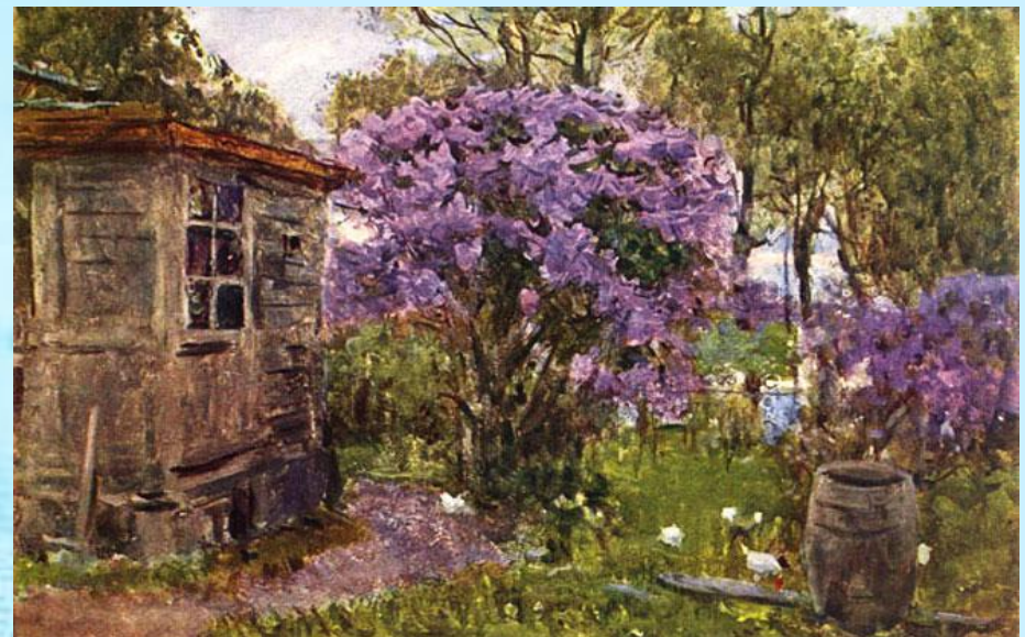
Сирень в цвету