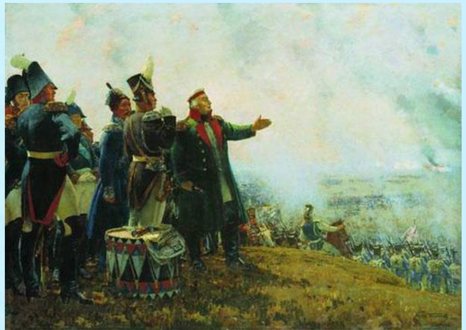
Кутузов на Бородинском поле