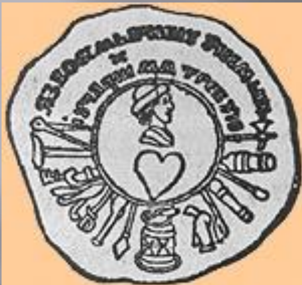
Учебная печать Петра I

"Азь бо есмь в чину учимых и учащих мя требую".