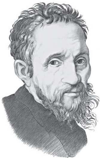
Микеланджело Буонарроти 1475—1564

Старинное предание гласит, что в конце XV века итальянский скульптор и архитектор, а еще поэт по имени Микеланджело Буонарроти впервые в жизни и в мире слепил снежную фигуру.