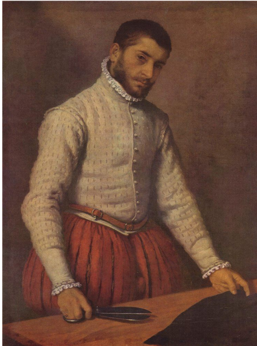
Giovanni Battista Moroni - The Tailor (Il Tagliaranni), Национальная галерея.

Сколько лет ножницам? Как они появились?