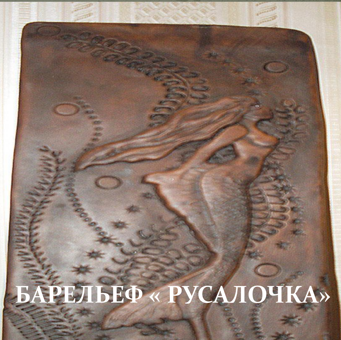
БАРЕЛЬЕФ « РУСАЛОЧКА »