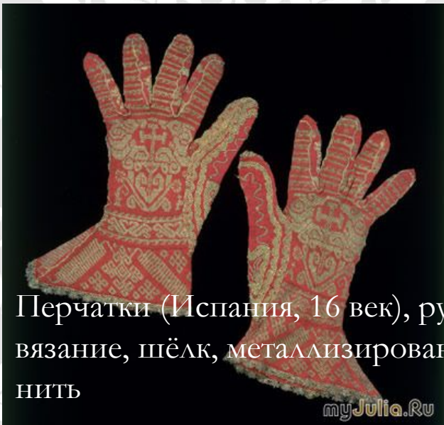
Перчатки (Испания, 16 век), ручное вязание, шёлк, металлизированная нить

Самые ранние известные вязанные изделия в Европе были сделаны мусульманскими вязальщицами, нанятыми членами испанской королевской семьи. Среди этих изделий обнаружили трикотажные наволочки и перчатки в гробнице принца Фернандо де ла Серда, умершего в 1275 году. Причём плотность и качество вязаного полотна наволочек сравнима с плотностью современного трикотажа машинной вязки — около двадцати петель на дюйм.