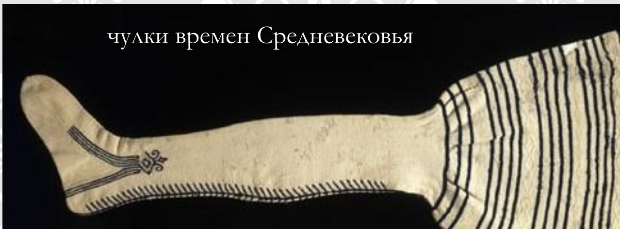
чулки времен Средневековья

Изначально вязаная одежда ценилась очень высоко и была недоступна простым смертным. Сегодня с трудом верится, что, например, во времена раннего средневековья позволить себе носить вязаные чулки могли разве что короли.