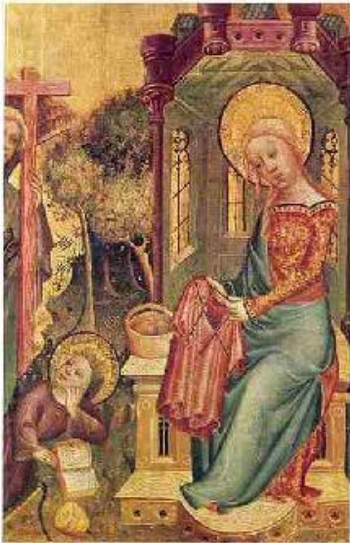
Богородица вяжет. Бертран Минден

Несколько европейских картин 14 века изображают Богоматерь за вязанием, например, “Посещение Ангела” 1400-1410 Мастера Бертрама Миндена.