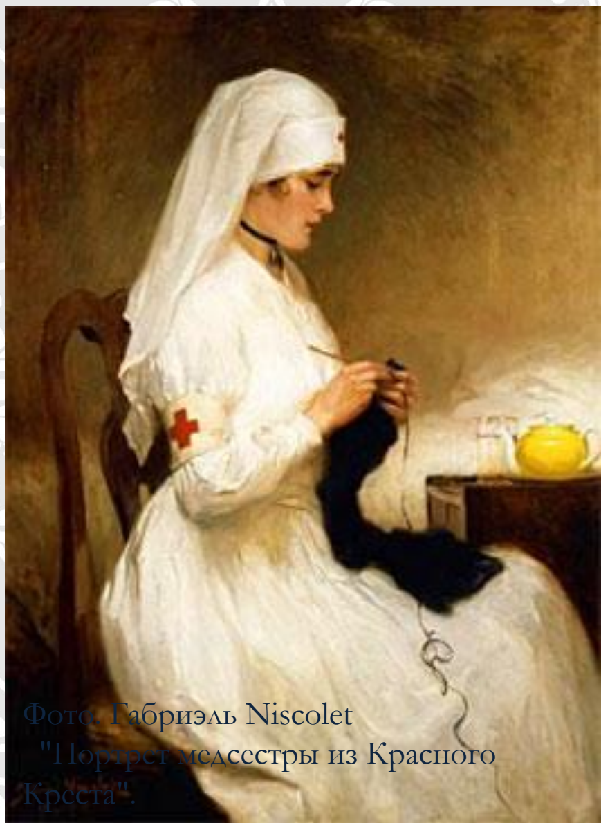
Фото. Габриэль Niscolet "Портрет медсестры из Красного Креста".

Специально выпущенные вязальные схемы балаклав и перчаток были распространены, чтобы обеспечить шерстяными вещами на зиму армию и флот. Эта акция не только помогла изготовить множество необходимых вещей, но и придала смысла деятельности женщин-домохозяек на их “домашних фронтах”.