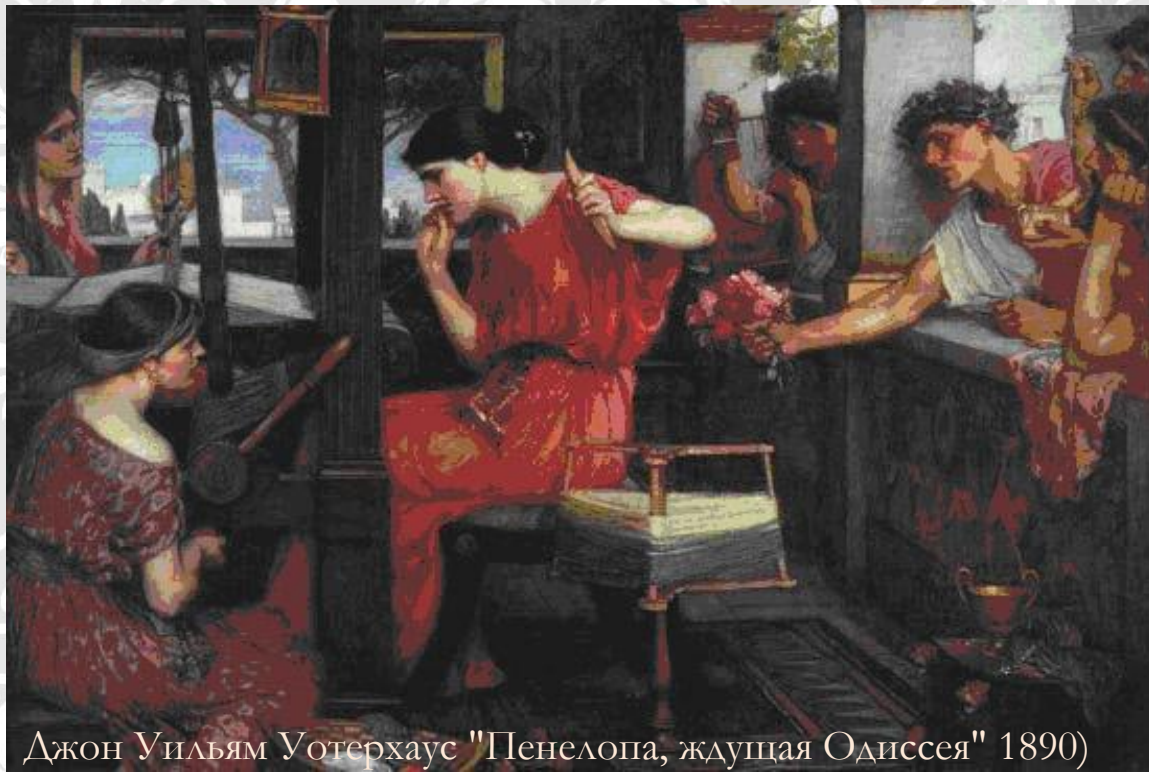
Джон Уильям Уотерхаус "Пенелопа, ждущая Одиссея" 1890)

Искусство вязания было известно древним Грекам еще во времена Троянской войны.