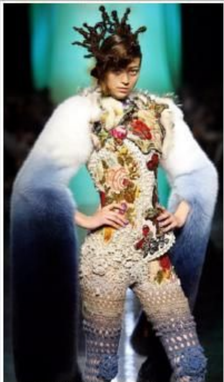
Модель от Жан-Поль Готье

В наши дни вязание как вид рукоделия продолжает развиваться: активно внедряются новые материалы, разрабатываются узоры, из трикотажа изготавливаются всевозможные аксессуары – начиная от головных уборов и заканчивая обувью.