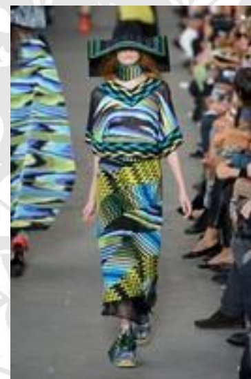
Missoni Spring 2011