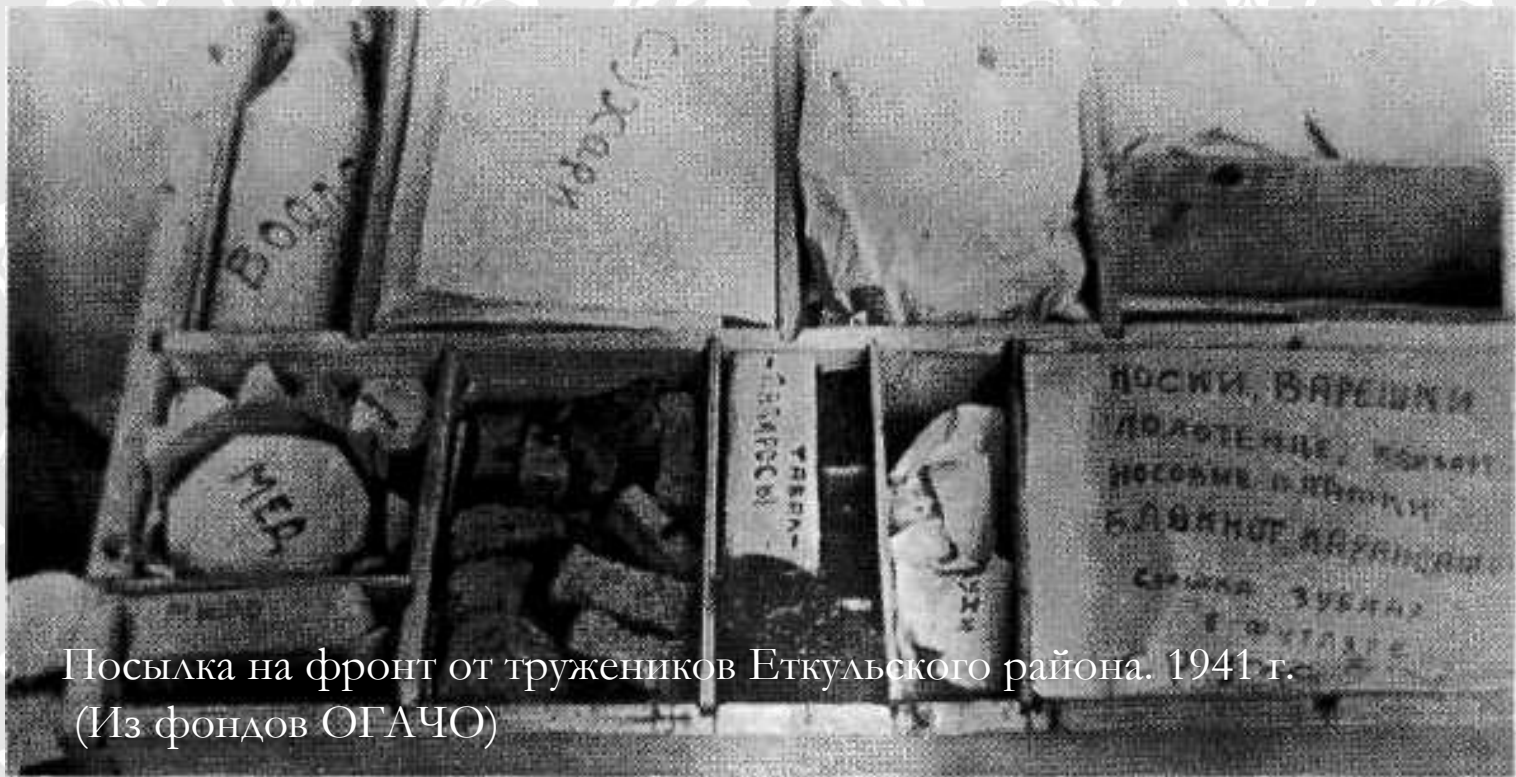
Посылка на фронт от тружеников Еткульского района. 1941 г.

Посылка на фронт представляла собой небольшой фанерный ящик, в котором складывали необходимые вещи для бойцов. Это был вклад жителей тыла в скорейший разгром врага. Посылка на фронт имела большое эмоциональное значение для бойцов. Это была посылка из дома, где все напоминало о мирной жизни, где их любили и ждали возвращения домой с победой.