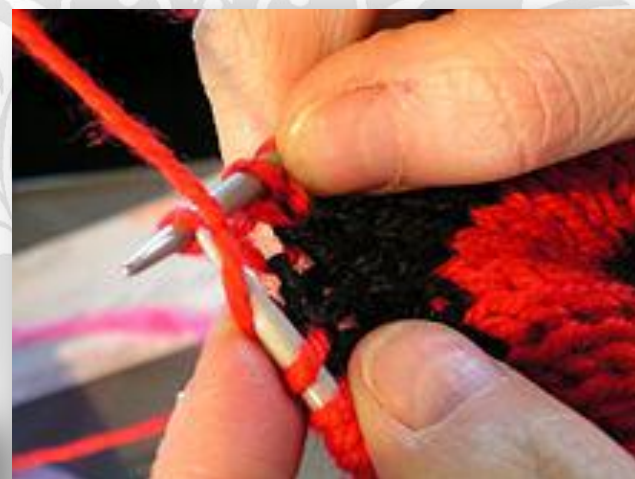
Вязание на спицах