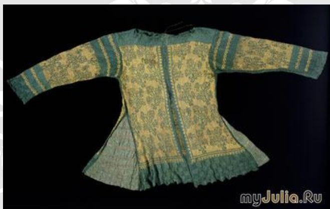
Жакет (Италия, 17-ый век), ручное вязание, шёлк

Расцвет вязания как ремесла приходится на XVI век, когда оно широко распространилось в Европе и даже превратилось в доходный промысел. А когда в 1589 году был изобретен вязальный станок и началось массовое изготовление трикотажа и изделий из него, вязаная одежда стала доступна каждому. К счастью, до сих пор ни на одной из машин не удалось повторить полотно, искусно связанное умелыми руками мастера, и поэтому изделия, изготовленные вручную, не только ценятся намного выше, чем фабричные, но и заслуженно возводятся в ранг произведений искусства.