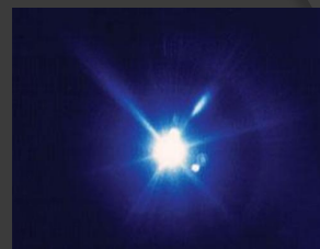
Фотон — элементарная частица, квант электромагнитного излучения.