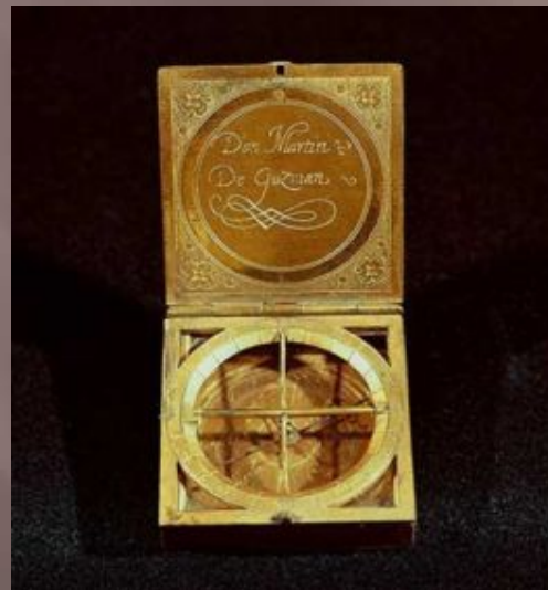
Портативные солнечные часы (Испания, 16в.)