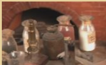
Микроскоп. Перегонный куб