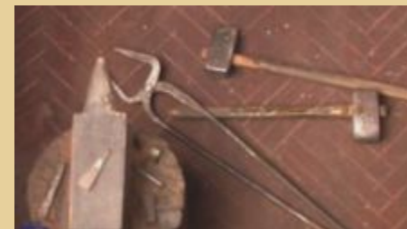
Топор, щипцы, ножницы большие крепкие, наковальня, молотки и кузнечные молоты

Кроме печей различной конструкции и назначения, лаборатория была оснащена химической посудой, различным оборудованием и приборами. В связи с необходимостью проводить исследование руд и других природных материалов М.В. Ломоносов уделил большое внимание оборудованию для пробирного анализа..