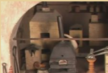
Плавильная печь, пробирная, перегонная

«Мы озаботились устроить их, — писал М. В. Ломоносов, — ввиду многообразного ежедневного их употребления: ведь все химические операции, производящиеся огнем, можно в них осуществлять надлежащим образом, если потребует необходимость».