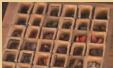
Ящик для мозаики природных материалов М.В.