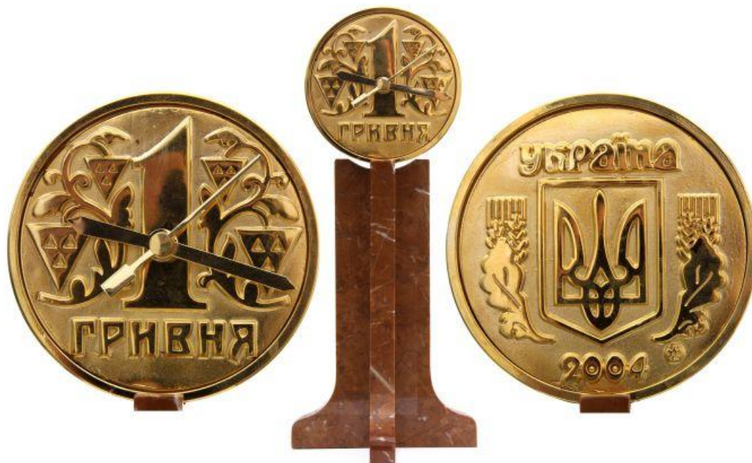
«1 гривня», действующие часы, медь - гальванопластика с позолотой, (президенту Национального Банка Украины и директору Банкіотно-монетного Двора Украины)