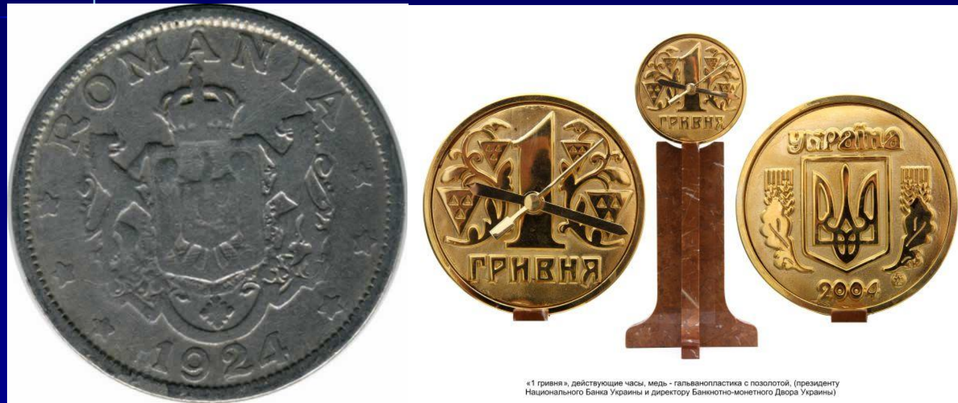
«1 гривня», действующие часы, медь - гальванопластика с позолотой, (президенту Национального Банка Украины и директору Банкіотно-монетного Двора Украины)