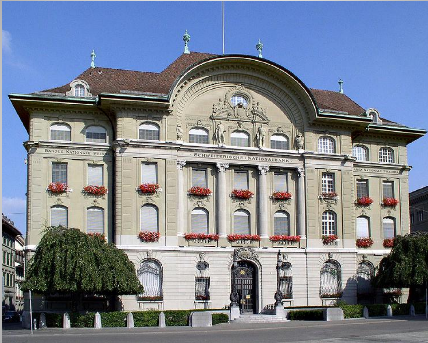
Банк в Швейцарии