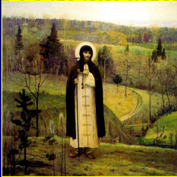
1) Сергей Радонежский