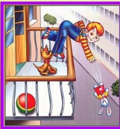
Не играй на балконе, упадешь