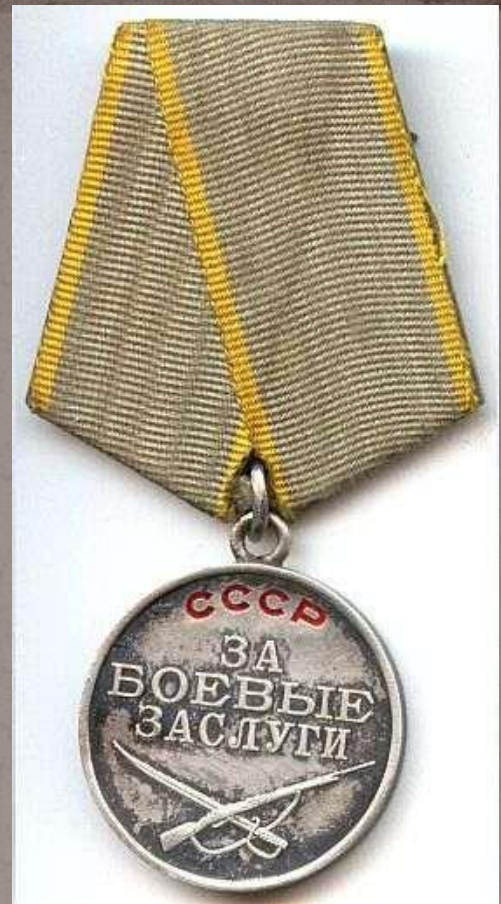
Медаль «За боевые заслуги»