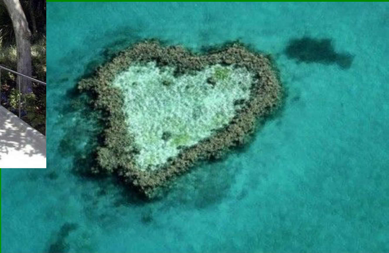
Коралловый риф в форме сердечка на Большом барьерном рифе в Австралии.