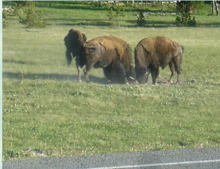
Бой бизонов за территорию.

Чрезмерное увеличение численности особей одного вида приводит к перенаселению сообщества, обострению внутривидовой конкуренции - борьбы за одни и те же ресурсы (территория, пища, лидерство в группе), происходящей между особями одного и того же вида.