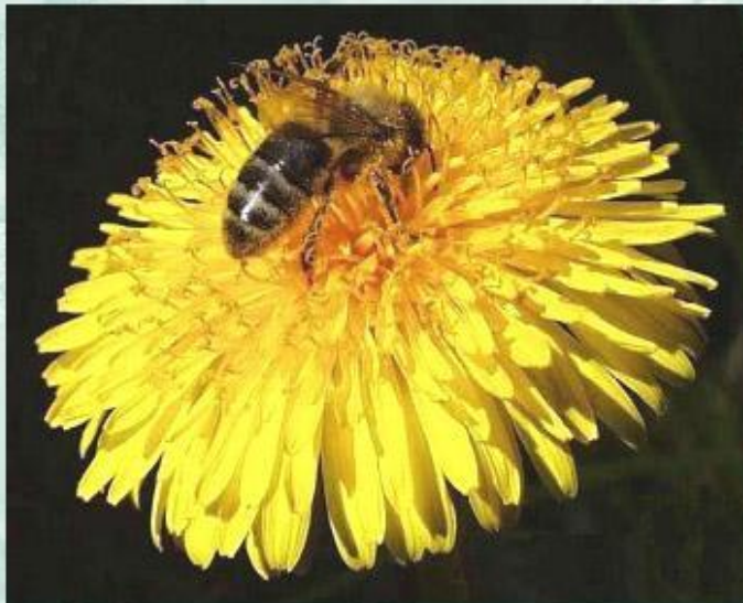
Один из примеров протокооперации - пчела, опыляющая цветок.

В природе встречается сожительство двух или более видов, при котором организмы-партнеры (или один из них) получают выгоду. Такой тип межвидовых взаимоотношений называется взаимопользными отношениями. Различают несколько форм такого сожительства живых организмов.