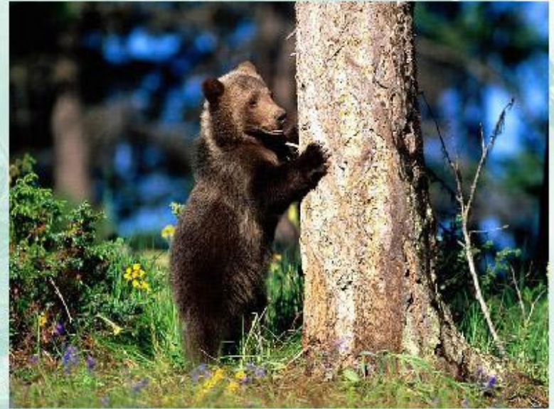
Бурые медведи метят свою территорию царапинами на деревьях.

Территориальность - это защита особью (или популяцией) занимаемой территории от других представителей (или популяций) этого же вида или иных видов. Для всех позвоночных животных территориальность обеспечивает условия, при которых каждая пара особей и ее потомство имеют достаточно места для питания и размножения.