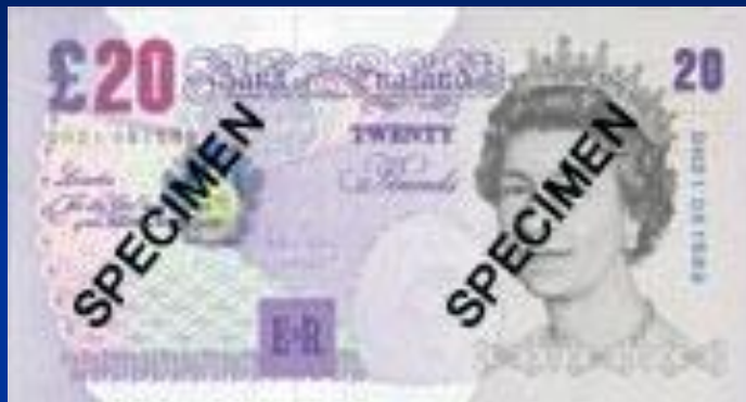
Британский фунт стерлингов