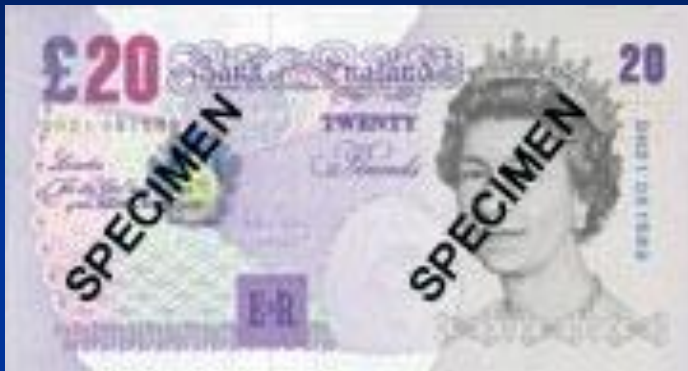
Британский фунт стерлингов