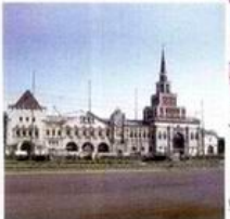
Казанский вокзал в Москве. Арх. А. В. Шусев