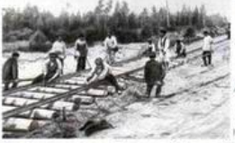
Строительство Транссибирской железной дороги