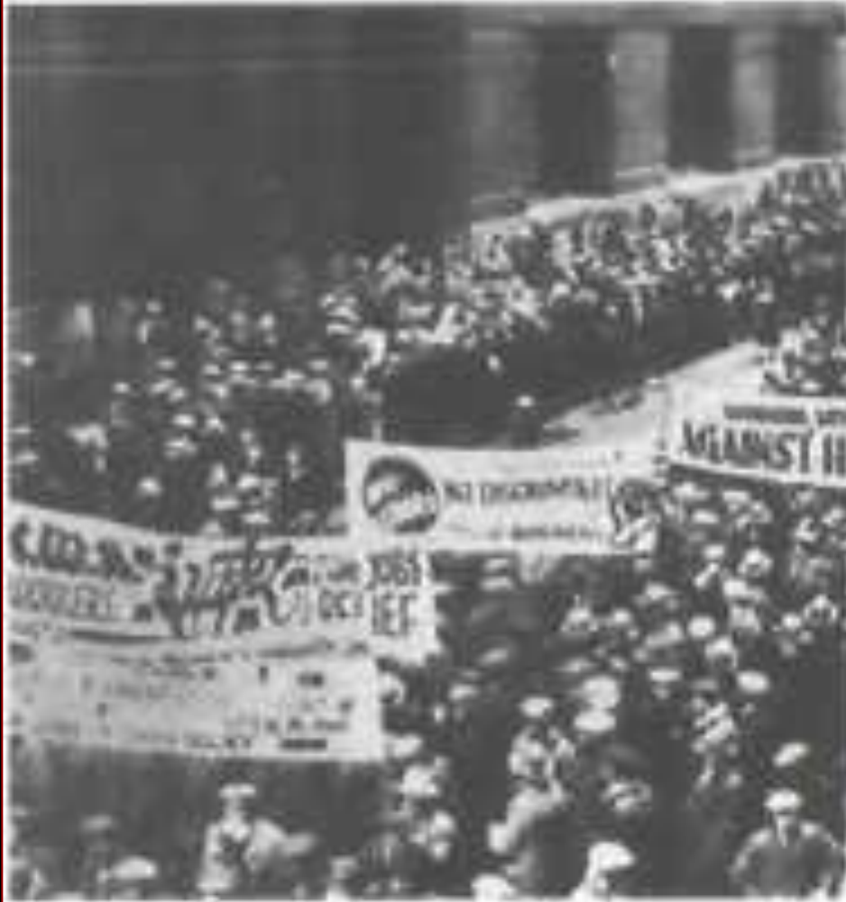
Массовая демонстрация в Англии.