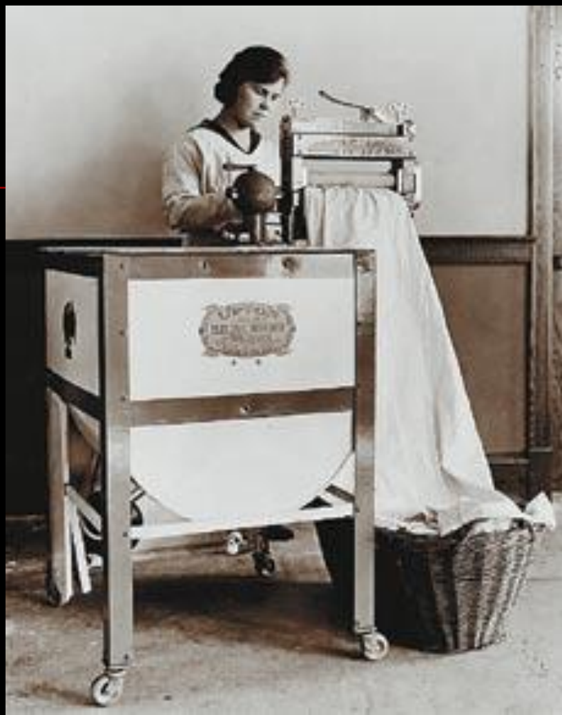
Холодильник и стиральная машина 1920-х годов