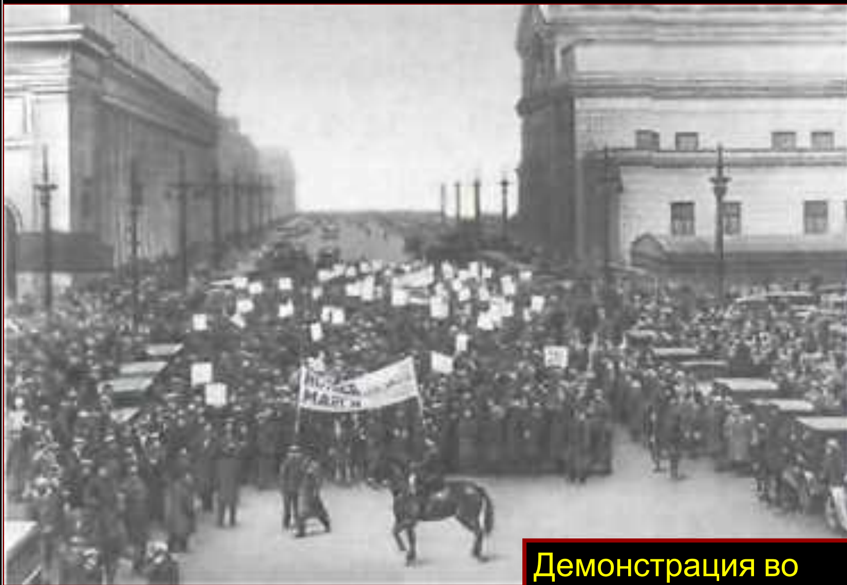
Демонстрация во Франции.