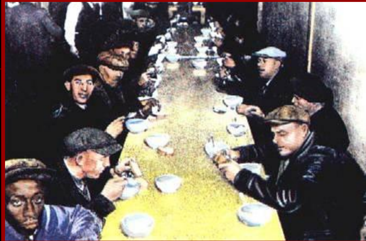
Бесплатная раздача супа.