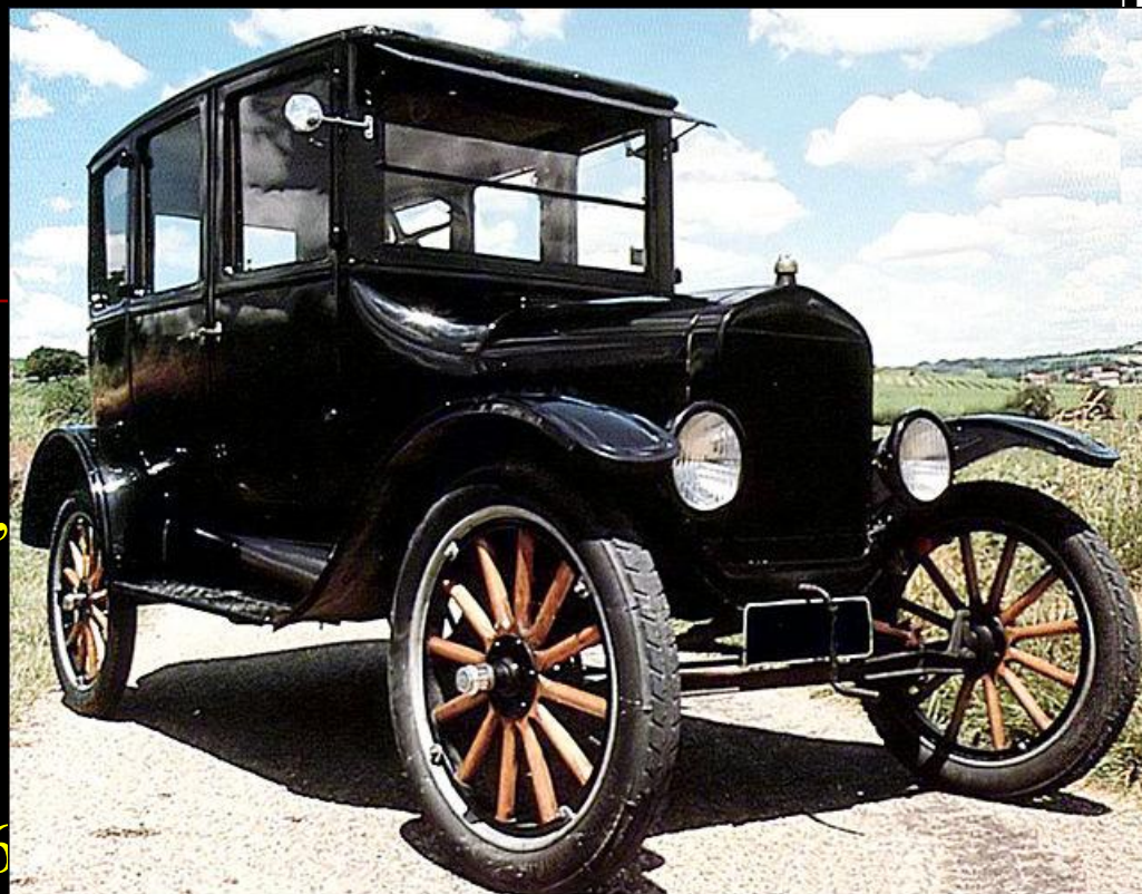
Форд, модель Т, получившая прозвище "Жестяная Лиззи".