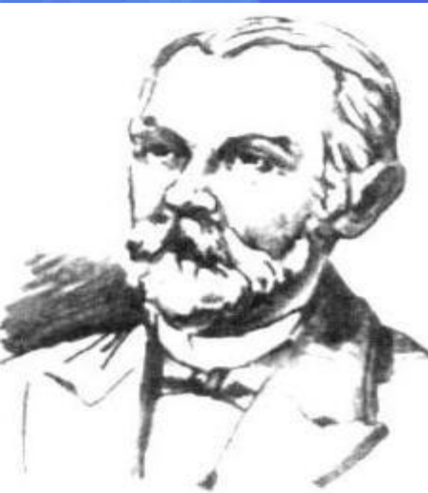
Дмитрий Иосифович Ивановский (1864—1920)