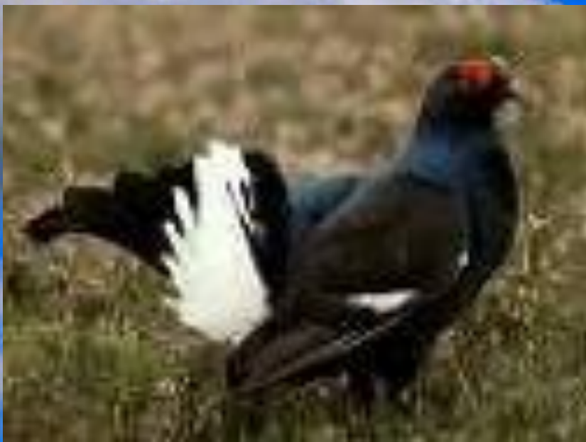
Тетерев - глухарь