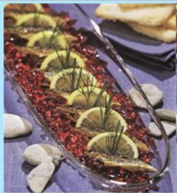
Миного в желе из черной смородины.