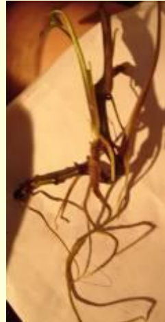
Образование придаточных корней на черенке сингониума