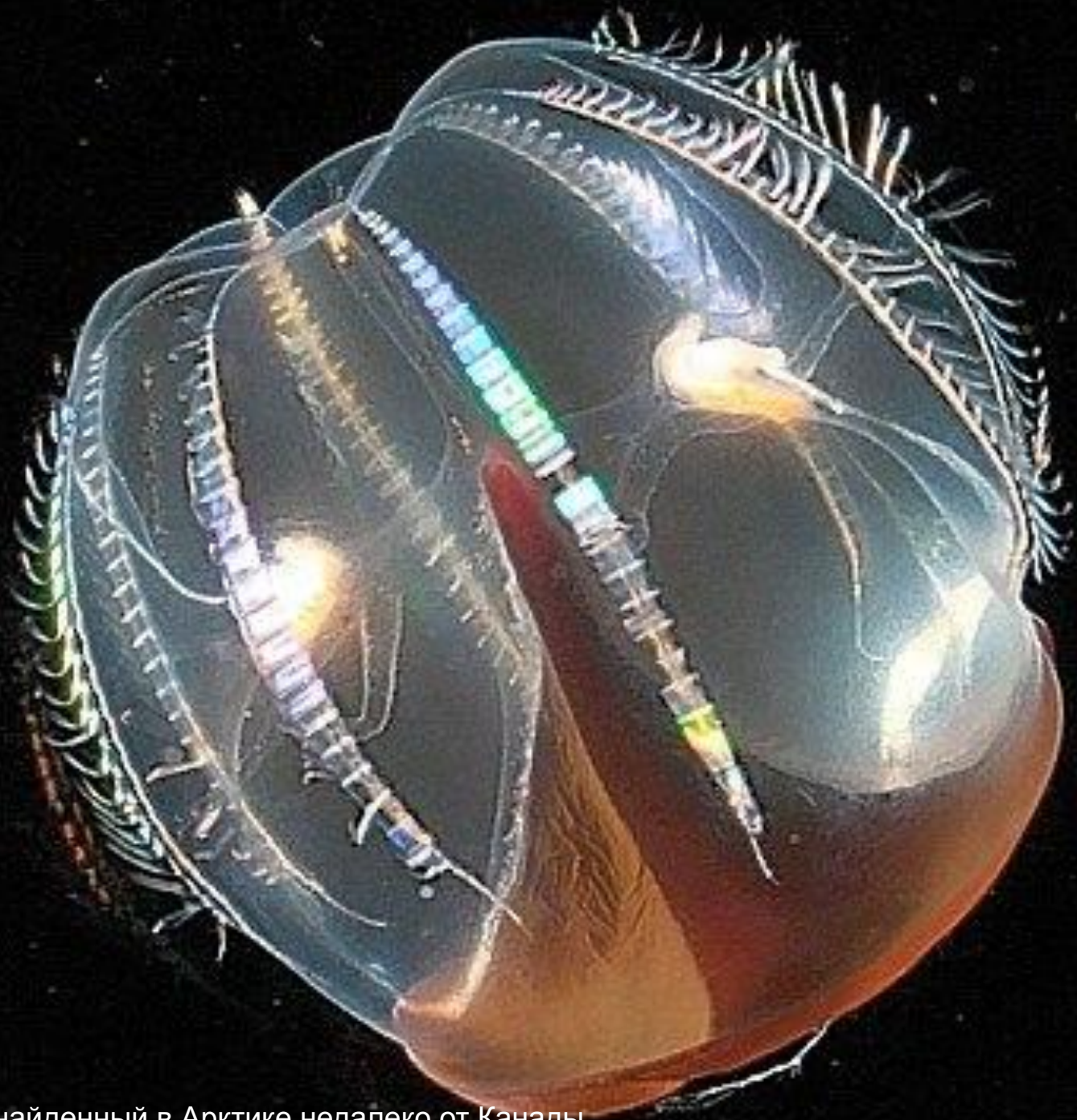
Гребневик, найденный в Арктике недалеко от Канады