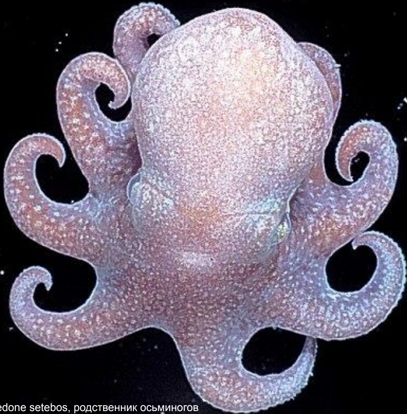
Megaleledone setebos, родственник осьминогов