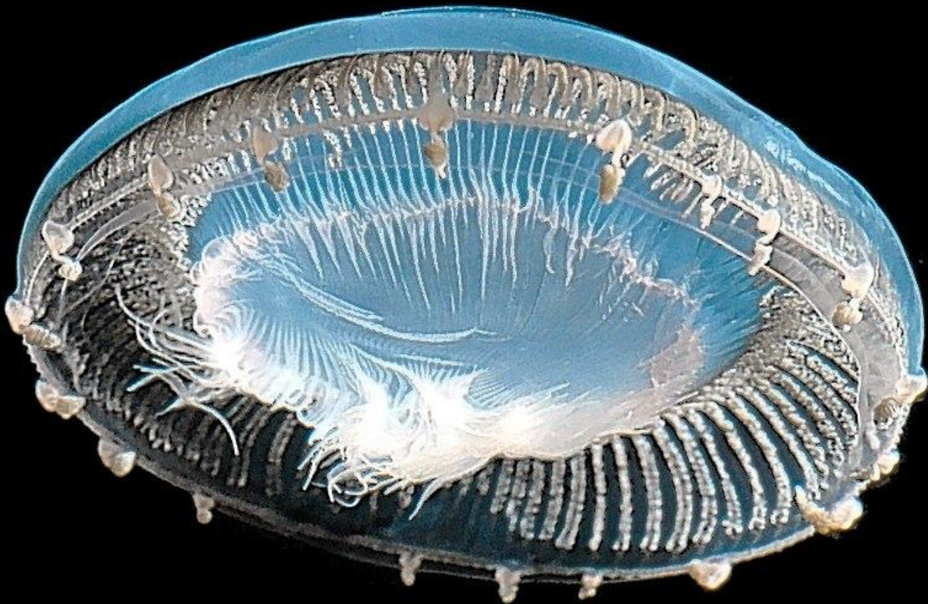
Aequorea macrodactyla : один из новых видов медуз, найденный в Тихом океане