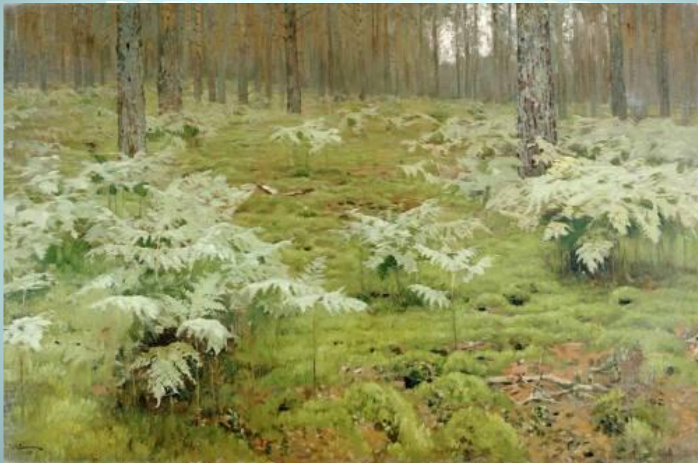
Левитан И.И. «Папоротники в бору»