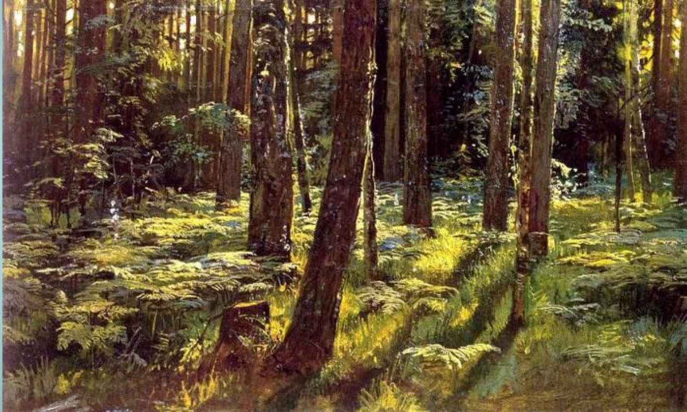
Шишкин И.И. «Папоротники в лесу»