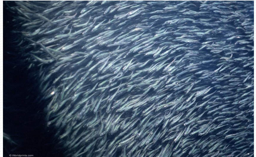
макрель, тунцов, терпугов