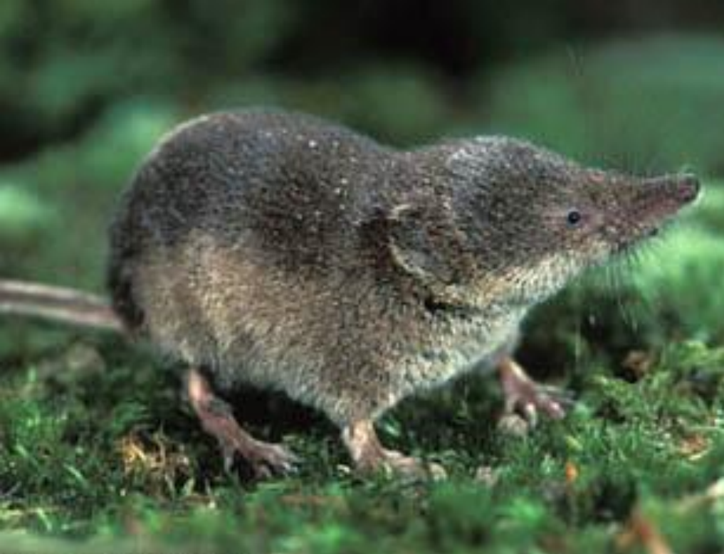
Бурозубка – крошка.