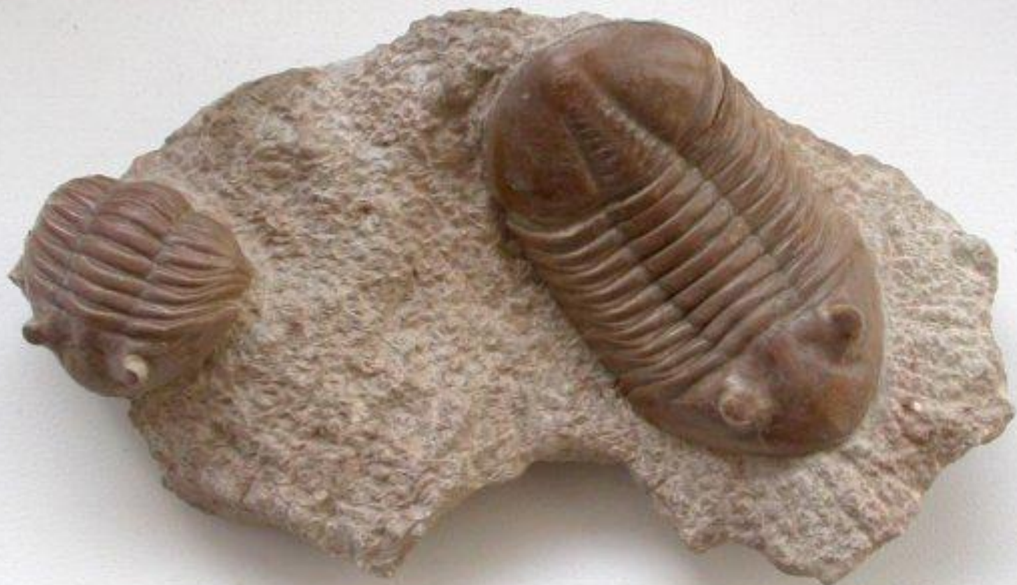
Ceratodus // Ammonit.ru