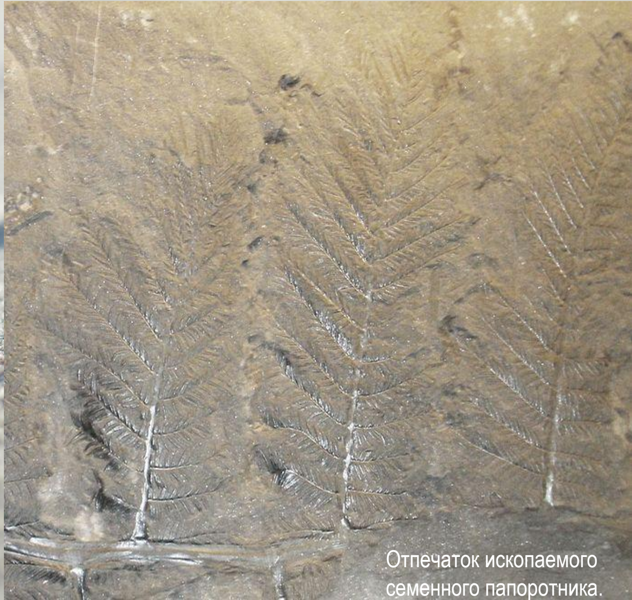
Отпечаток ископаемого семенного папоротника.

В ордовикском периоде господствовали бактерии. Продолжали развиваться сине-зелёные водоросли. Пышного развития достигают известковые зелёные и красные водоросли, обитавшие в тёплых морях на глубине до 50 м. О существовании наземной растительности свидетельствуют остатки спор и редкие находки отпечатков стеблей, вероятно, принадлежавших сосудистым