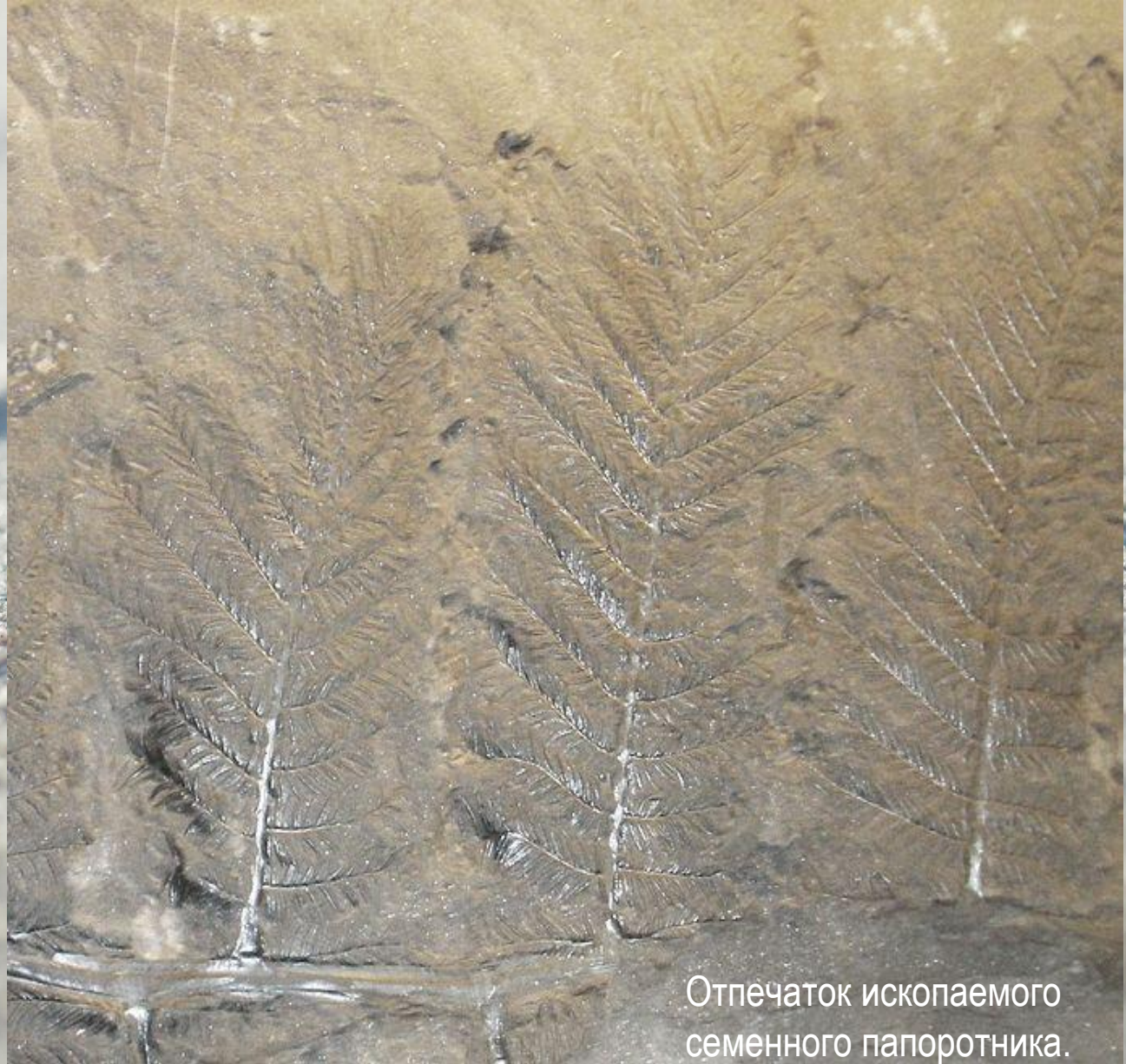
Отпечаток ископаемого семенного папоротника.

В ордовикском периоде господствовали бактерии. Продолжали развиваться сине-зелёные водоросли. Пышного развития достигают известковые зелёные и красные водоросли, обитавшие в тёплых морях на глубине до 50 м. О существовании наземной растительности свидетельствуют остатки спор и редкие находки отпечатков стеблей, вероятно, принадлежавших сосудистым