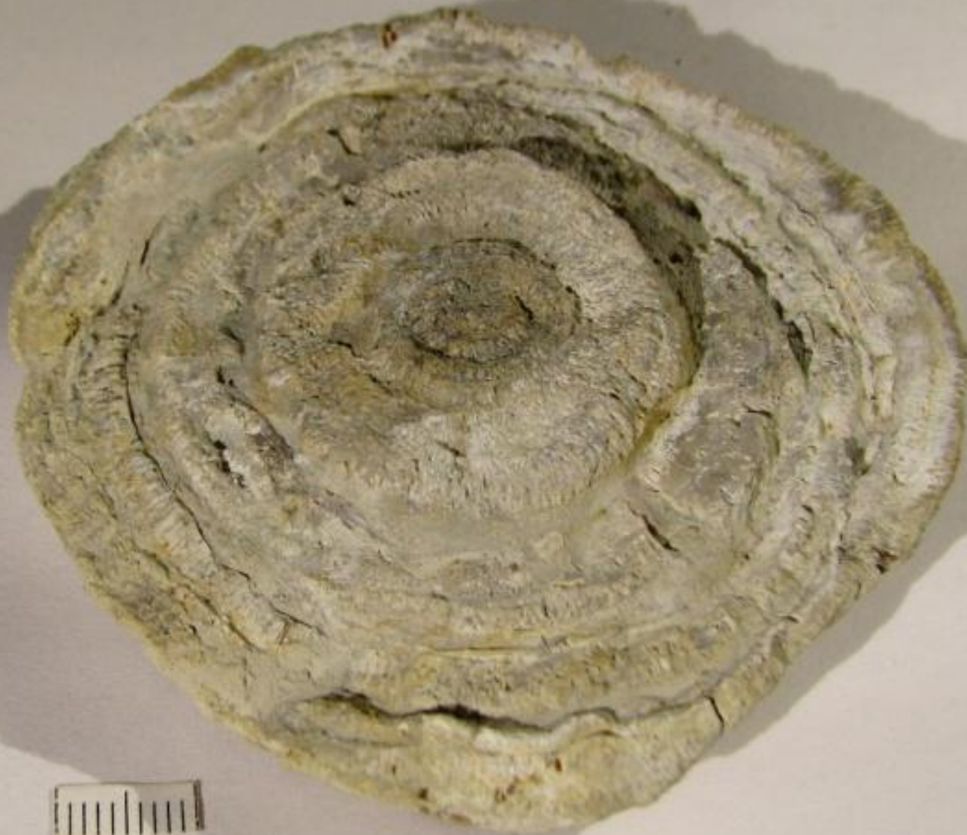
Крупная мшанка ордовикского периода.