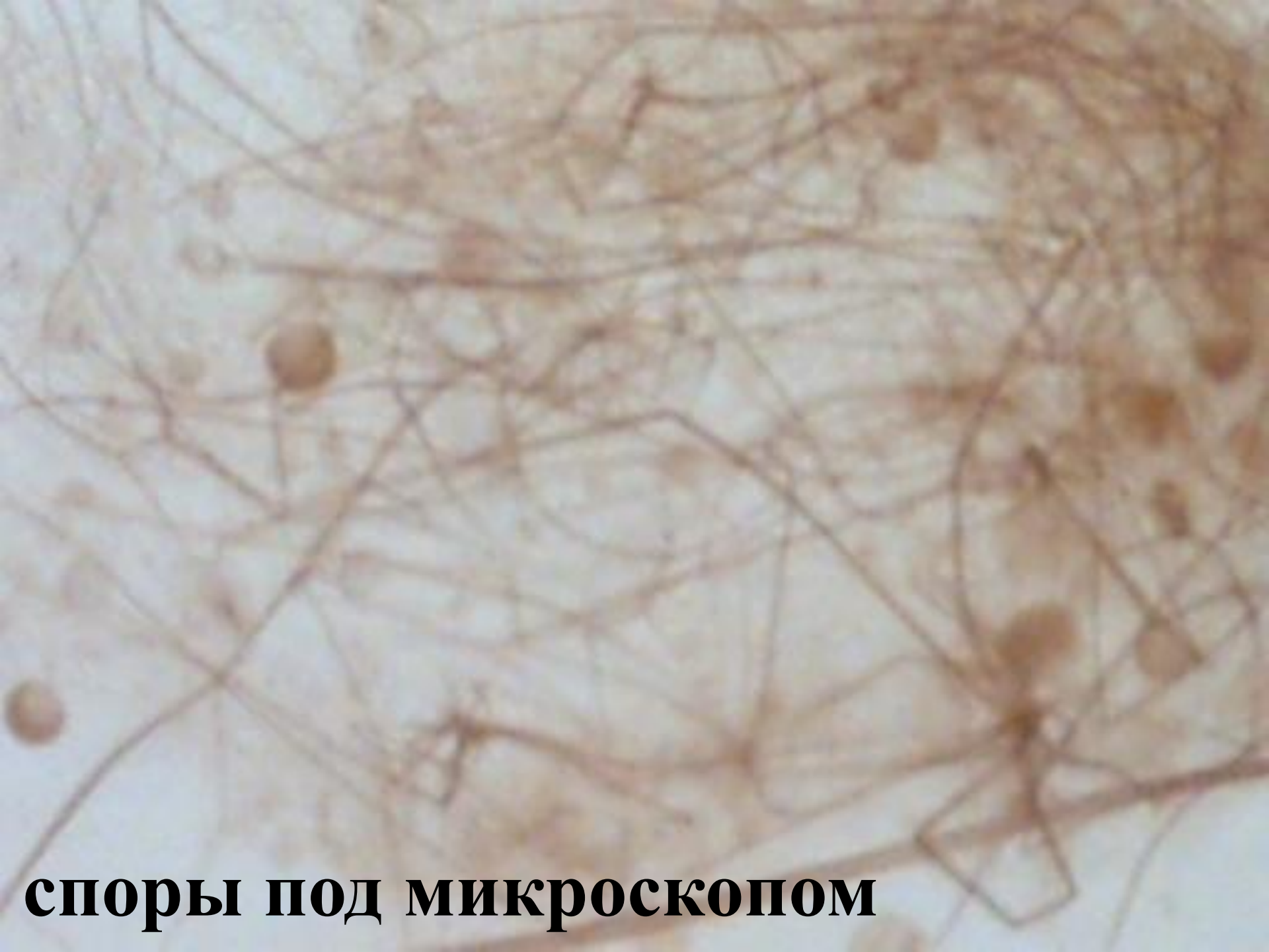
споры под микроскопом