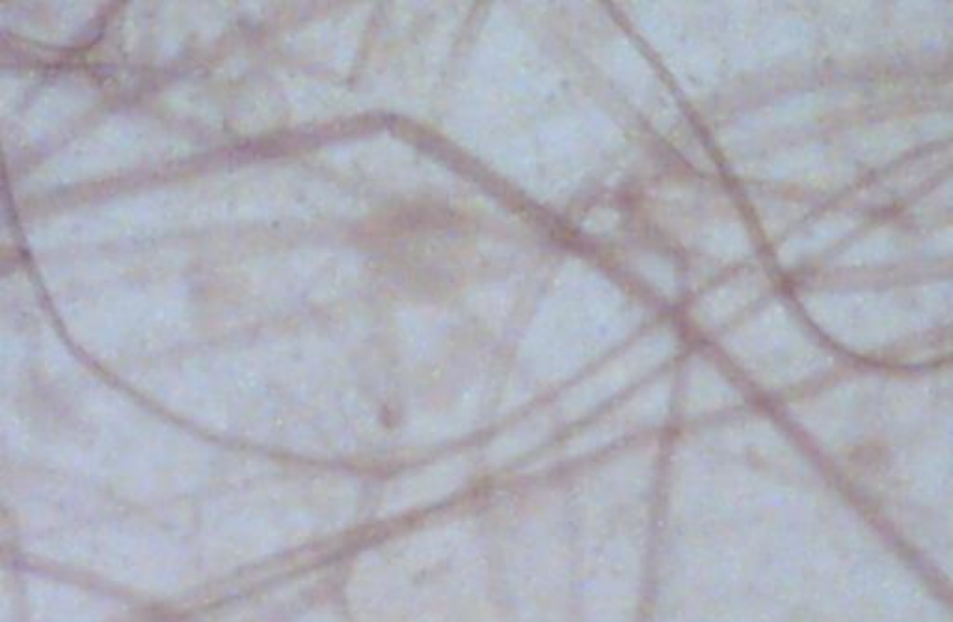
гифы гриба мукор