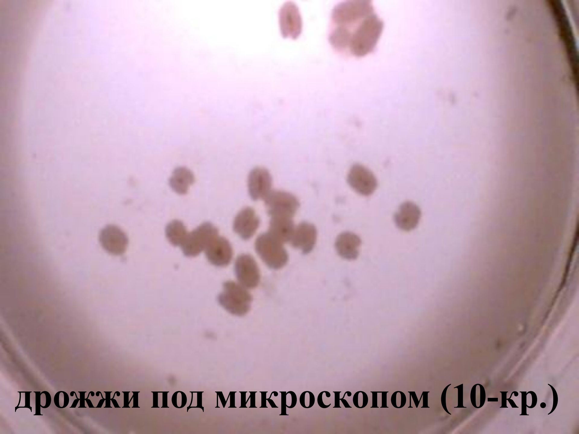
дрожжи под микроскопом (10-кр.)