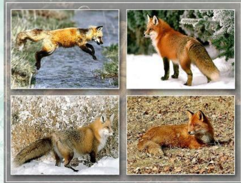
Особи разных популяций обыкновенной лисицы.

Различия в строении, размножении и поведении особей обусловлены разными условиями среды обитания популяций. Например, лисицы, обитающие на Дальнем Востоке, отличаются от лисиц, обитающих в Западной Европе.