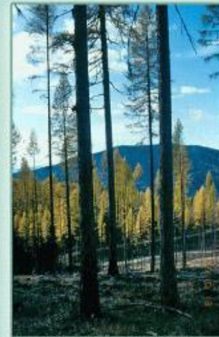
Лиственница даурская западная

Западная и восточная популяции даурской лиственницы.