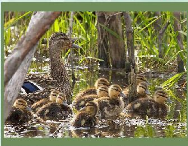
Утка кряква с утятами.