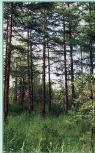
Лиственница даурская восточная

Географическая популяция - совокупность экологических популяций, заселивших географически сходные районы. Географические популяции существуют автономно, ареалы их относительно изолированы, обмен генами происходит редко - у животных и птиц - во время миграций, у растений - при разносе пыльцы, семян и плодов. На этом уровне происходит формирование географических рас, разновидностей, выделяются подвиды. Например, расы лиственницы даурской: западная (к западу от реки Лены) и восточная (к востоку от Лены).