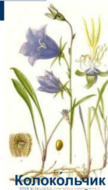
Колокольчик персиколист ный