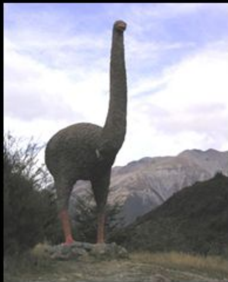
Реконструкция птицы моа

Гигантская птица, похожая на страуса, моа , обитавшая на островах Новой Зеландии предположительно до начала XIX века, имела большой рост - 3,7 м, а весила около 230 кг. Яйца очень большого объема (около 9 л). На Мадагаскаре они сохранялись до 18-19 веков и вымерли из-за уничтожения тропических лесов, где они обитали