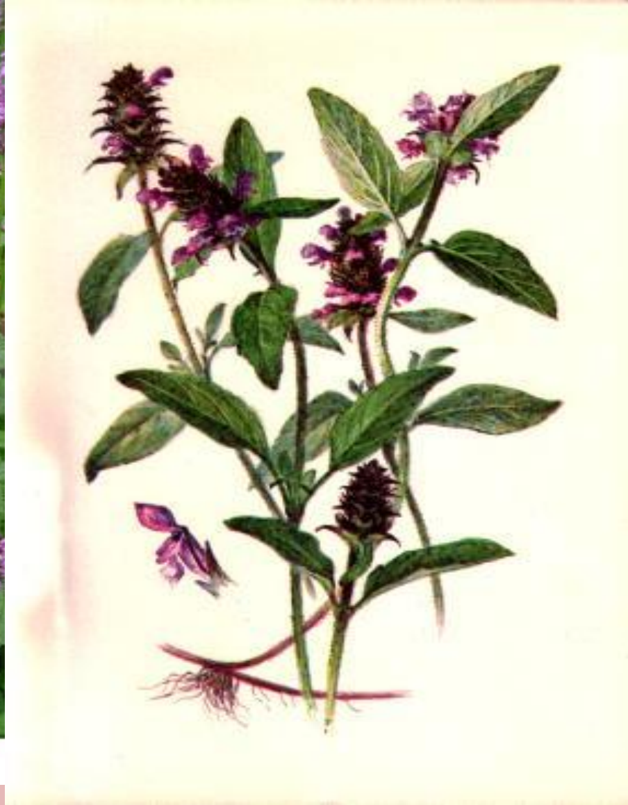
Lamiaceae - BETONICA OFFICINALIS - bukvice lékařská