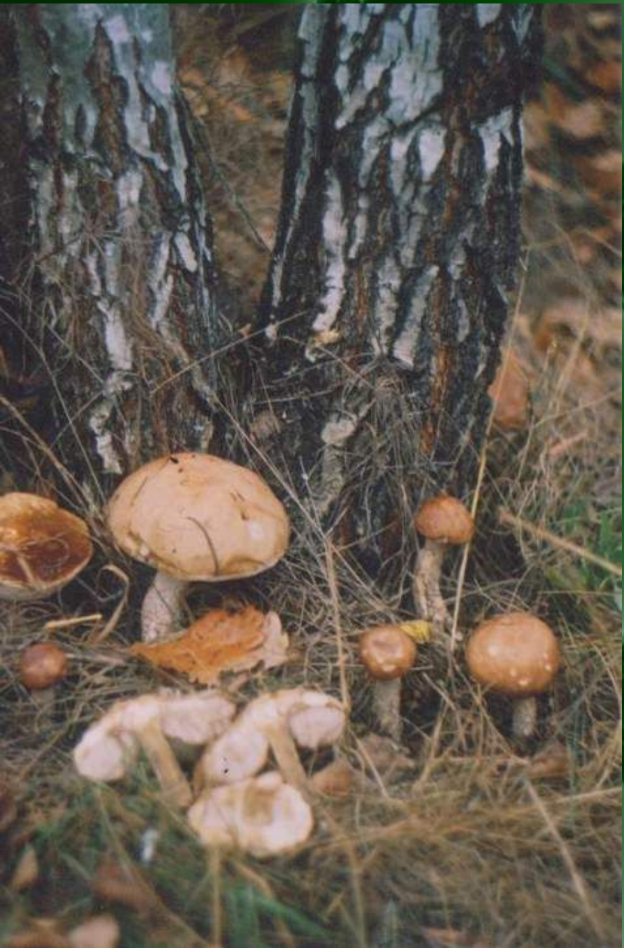
Підберезовик Boletus scaber