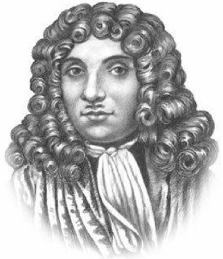
ЛЕВЕНГУК Антони Ван 1632-1723

И вот однажды он навел свою лупу на капельку воды, которую взял из кувшина, стоящего во дворе. В этой капле он увидел огромное количество быстро движущихся существ разного вида. Левенгук назвал их "анималькусы"; по-русски это значит "зверьки". Он решил выяснить, откуда берутся эти "зверьки". Может быть, они падают с неба? Он взял чисто вымытое блюдо и во время дождя собрал в него воду. "Зверьков" в воде не оказалось.