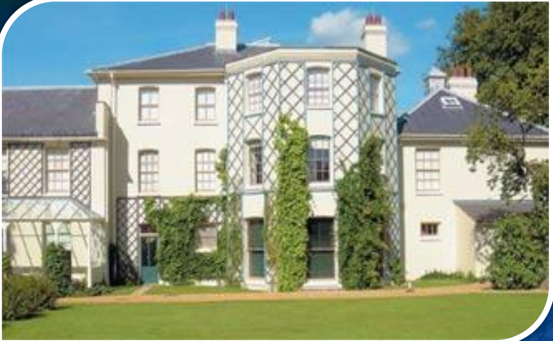
Дом в Доуне, где Ч. Дарвин жил в течение 40 лет (с 1842 по 1882 год).