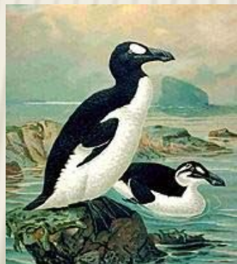
Бескрылая гадарка была истреблена в середине 19 века.