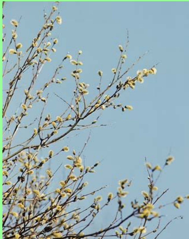
Ива. Мужские цветы