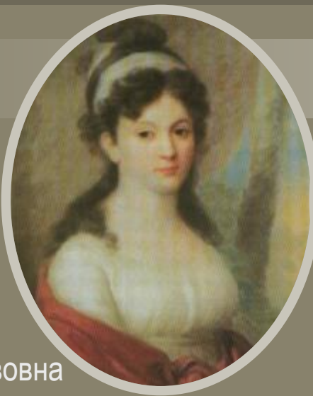
Мать Тютчева Екатерина Львовна