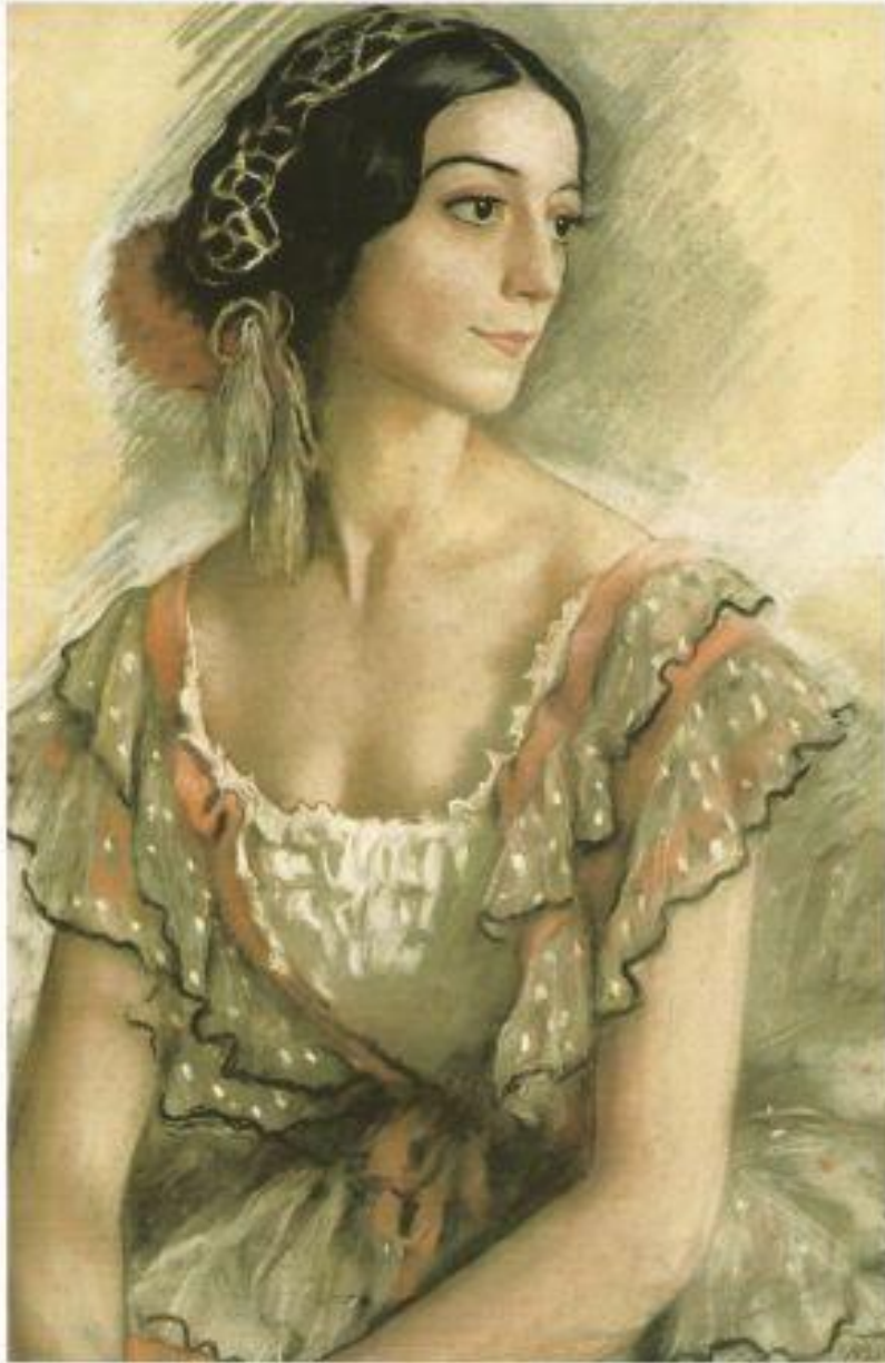
З.Серебрякова «Портрет балерины В.К. Ивановой в костюме испанки» 1924