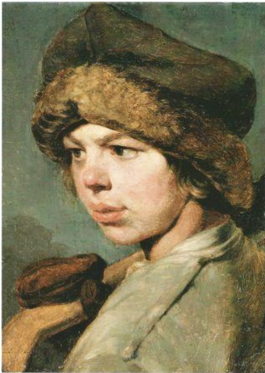
А. Венецианов «Захарка» 1825