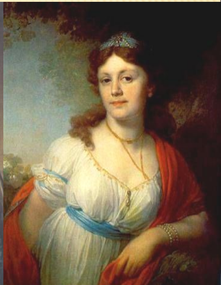
Ф.С.РОКОТОВ «ПОРТРЕТ А.П. СТРУЙСКОЙ»