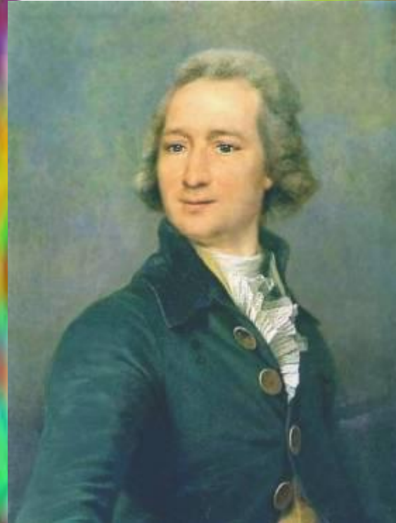
Д.Г.Левицкий Портрет Ивана Ивановича Дмитриева ( 1760 - 1837)