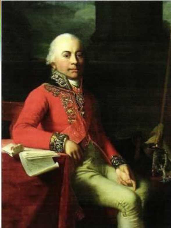
Ж. -Л. Монье. Портрет Муравьева Михаила Никитича ( 1757 - 1807 )