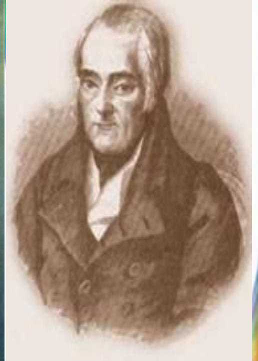
Юрий Александрович Нелединский-Мелецкий (1752 – 1829)