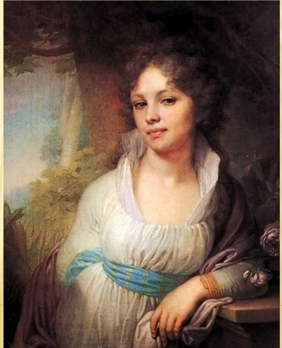
В.Л. Боровиковский. Портрет М.И.Лопухиной

ПРЕКРАСНА ТЫ В ВЛАСАХ СВОИХ, ХОТЬ ИХ НИКАК НЕ УБИРАЕШЬ, НО ТЫ НАРЯД ТАКОЙ ЛИШЬ ЛЮБИШЬ, В КОТОРОМ НЕЖНОСТЬ ПРОСТОТЫ БЛЕСТИТ ОТ СИЛЫ КРАСОТЫ Ф.ДМИТРИЕВ- МАМОНОВ