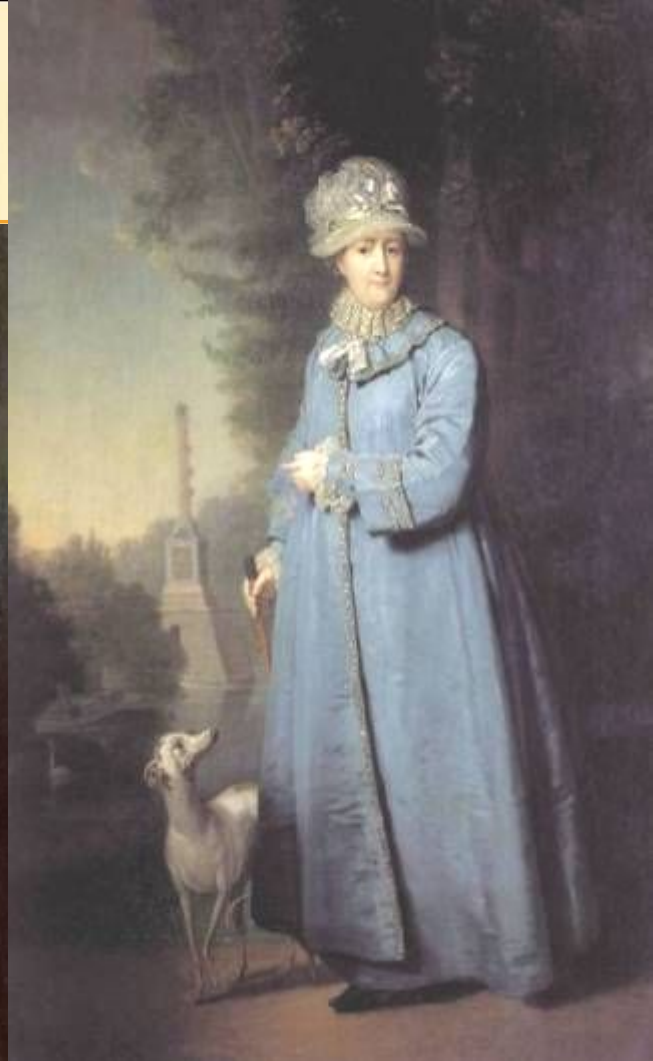
В.Л.Боровиковский Портрет великой княжны Александры Павловны