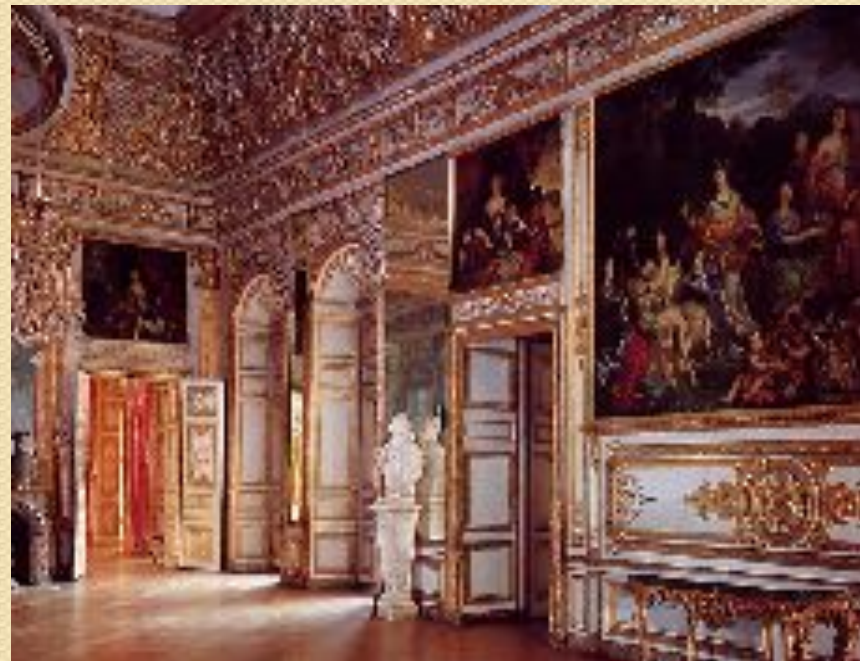
Версаль. Интерьер. Франция 1661