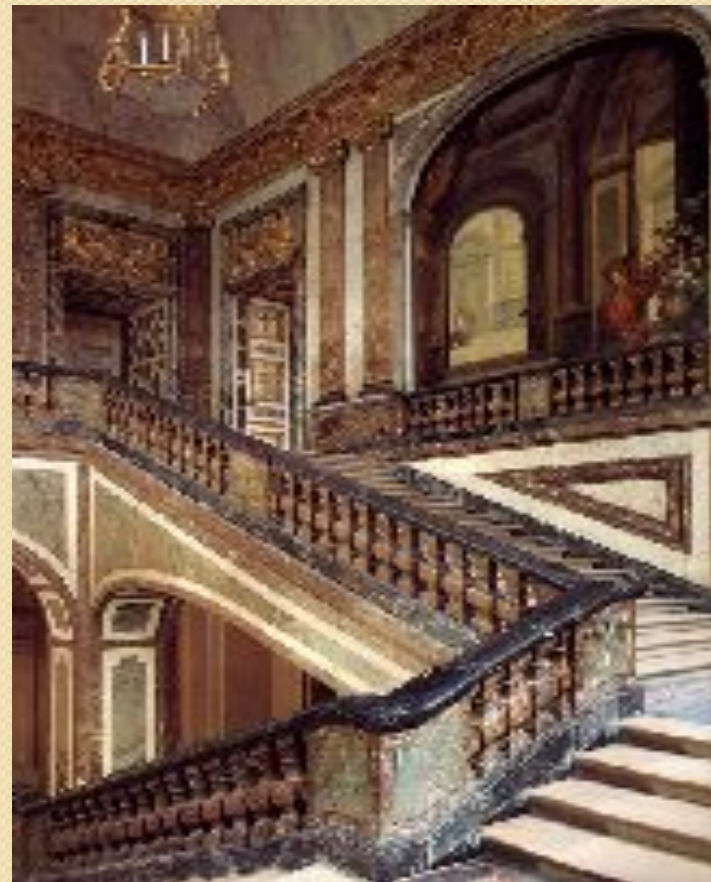
Версаль. Лестница. Франция 1679 - 1681