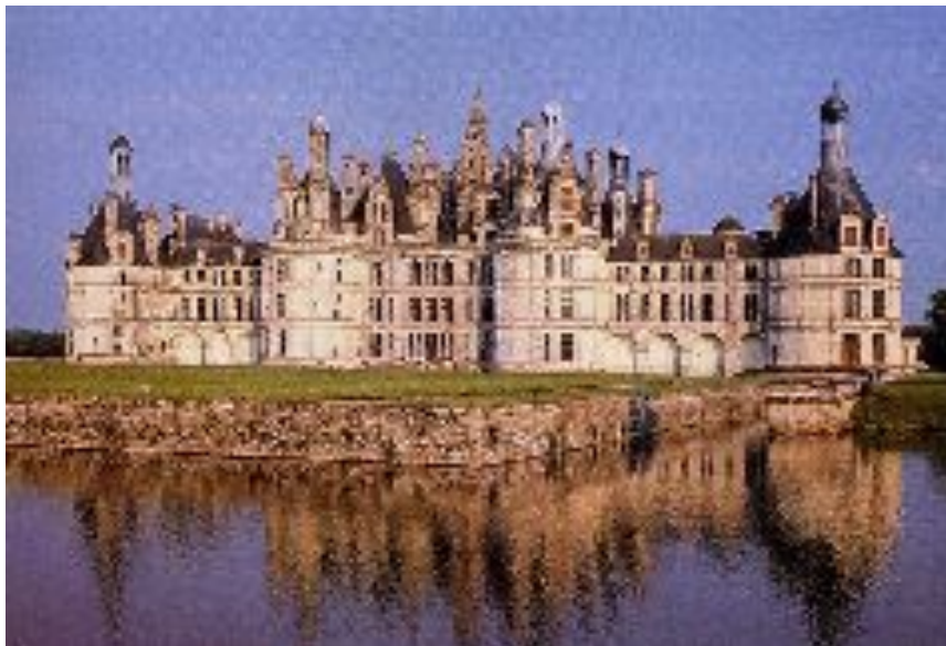
Замок Шамбор Кортон Д. Франция 1519