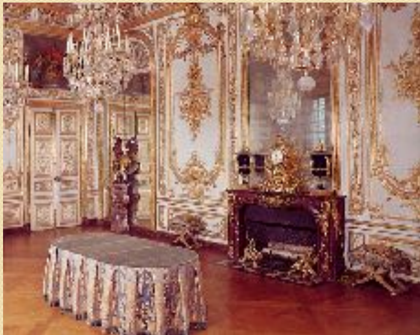
Версаль. Интерьер. Франция 1661