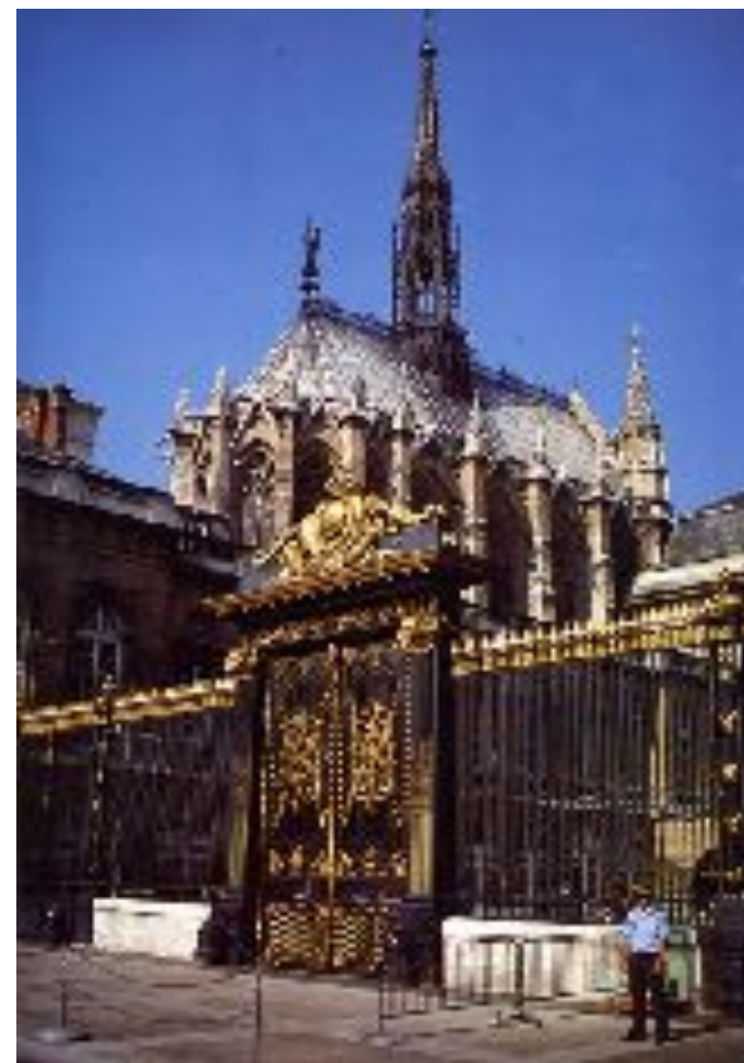
Сен-Шапель Франция 1243 – 1248