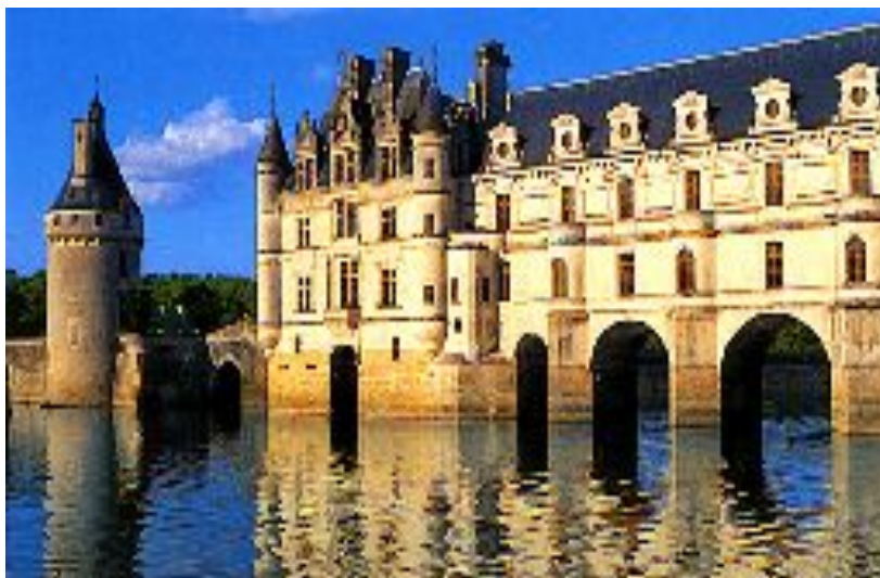
Замок Шенонсо Франция 1533 - 1580