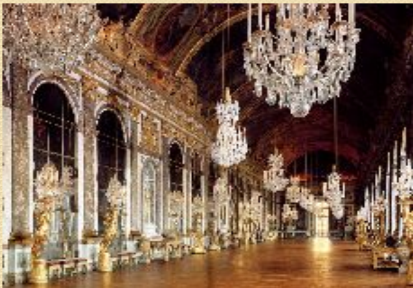
Версаль. Зеркальный зал. Франция 1661