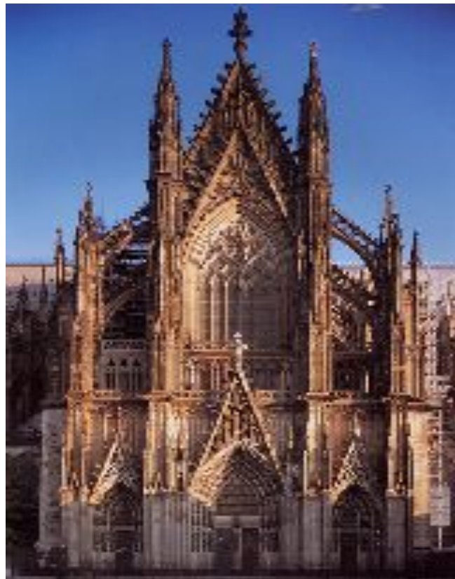
Собор в Кёльне. Южный фасад Германия 1248 - 1437; 1842 - 1880