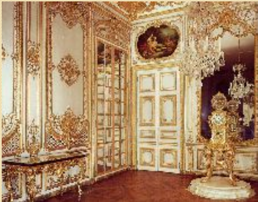
Версаль. Интерьер. Франция 1661