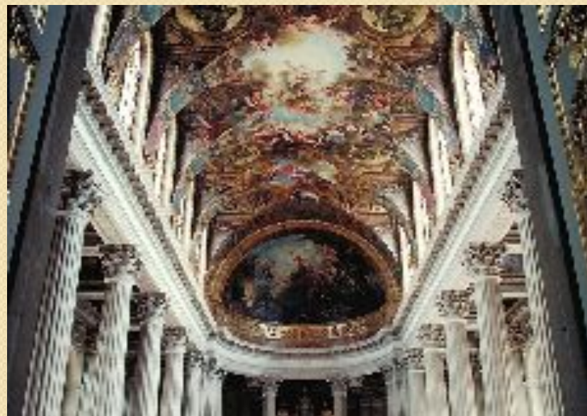
Версаль. Дворцовая капелла. Свод. Франция 1698 - 1710