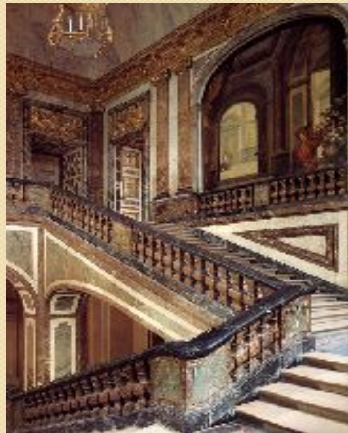
Версаль. Лестница. Франция 1679 - 1681