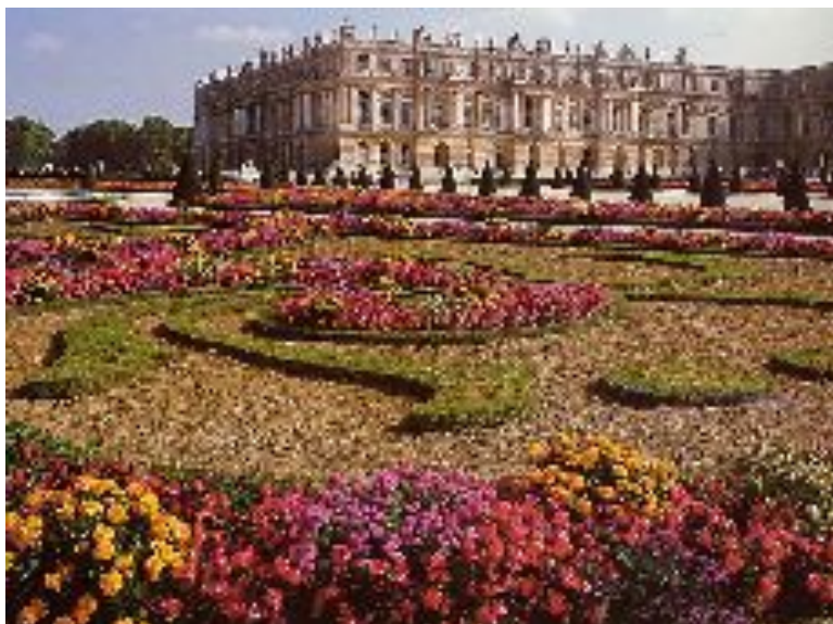
Версаль. Парк Франция 1661