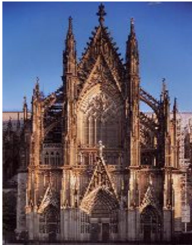
Собор в Кёльне. Южный фасад Германия 1248 - 1437; 1842 - 1880