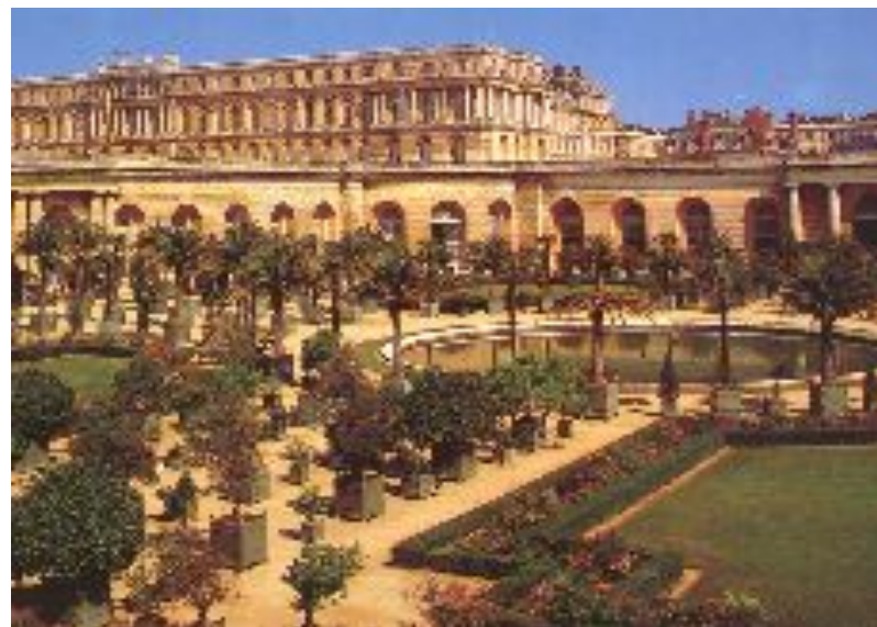
Версаль. Парк Франция 1661