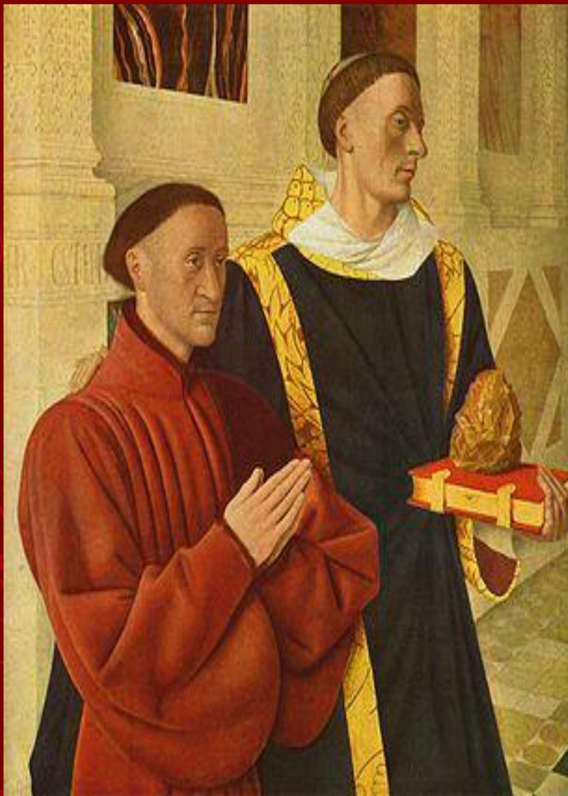
Жан Фуке. Этьена Шевалье и Св. Стефан.

Шедевром Фуке являются миниатюры « Часовая Этьена Шевалье » (1450-1460), не имевшие себе равных по художественным достоинствам. Особенно хороши миниатюры « Благовещение », « Встреча Марии и Елизаветы », и другие, созданные на сюжеты Священного писания. В конце 1450-х гг. мастер создал иллюстрации к сборнику новелл Джованни Боккаччо.