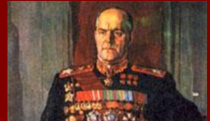
Маршал Георгий Константинович Жуков