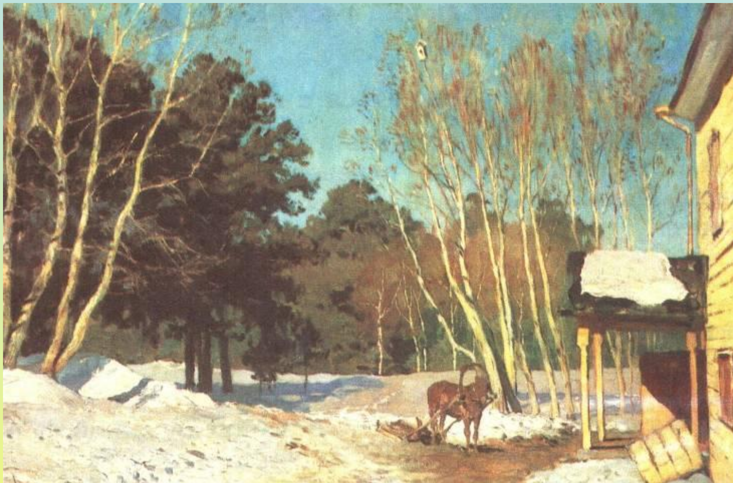
И. И. Левитан «Март»