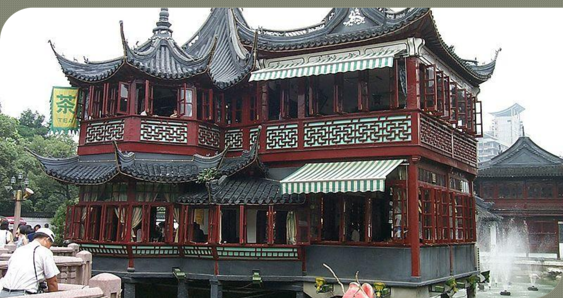
Чайный дом в Шанхае