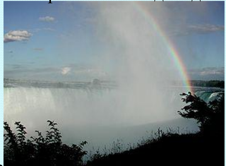
3. Водопад «Подкова»