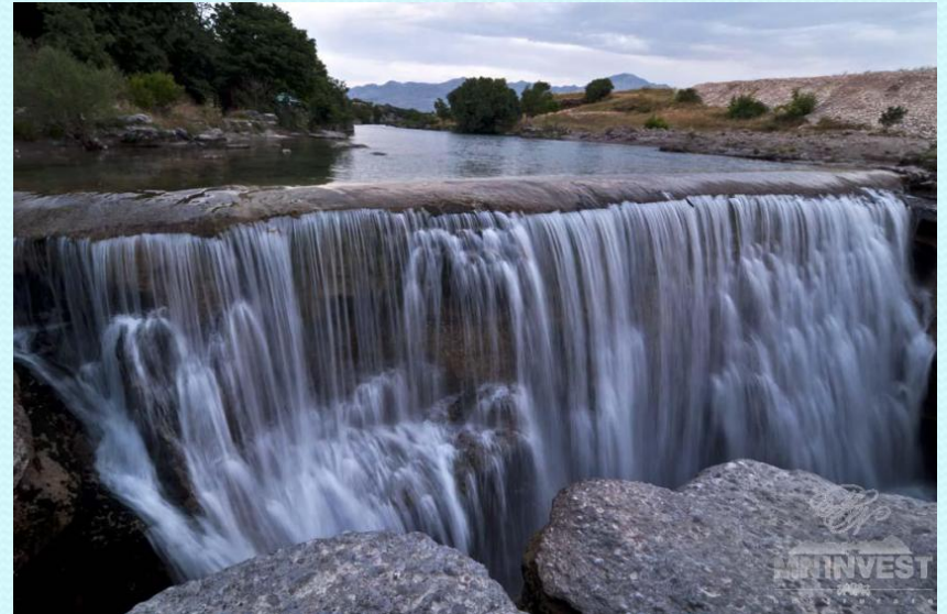
2. Американский водопад