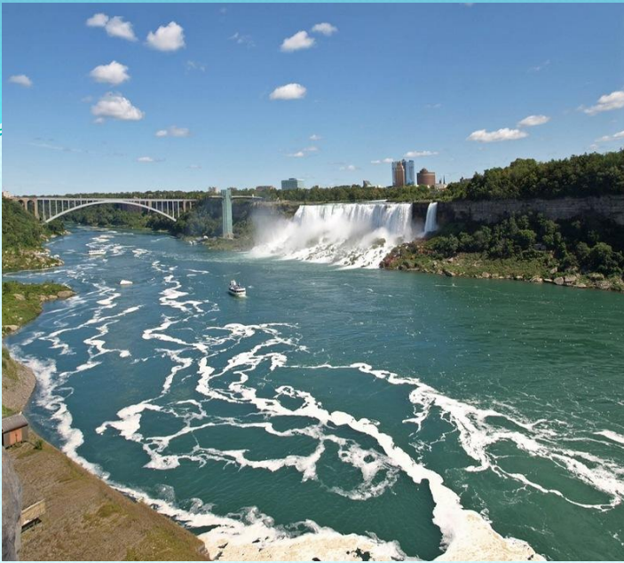
1. Водопад «Фата»