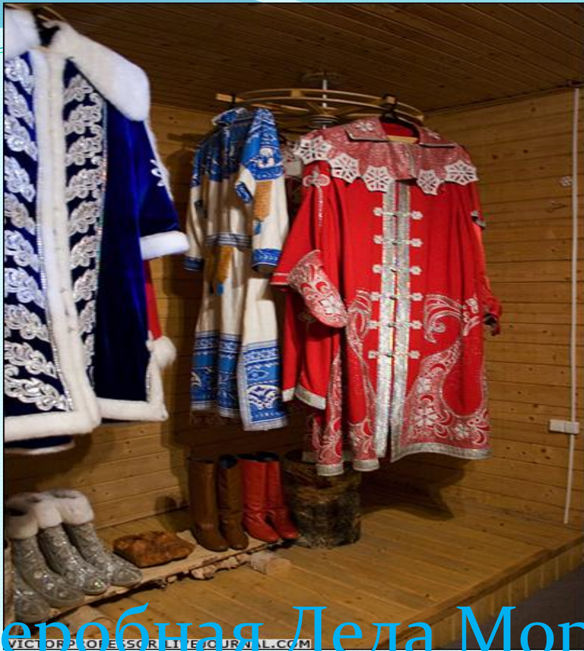
Гардеробная Деда Мороза