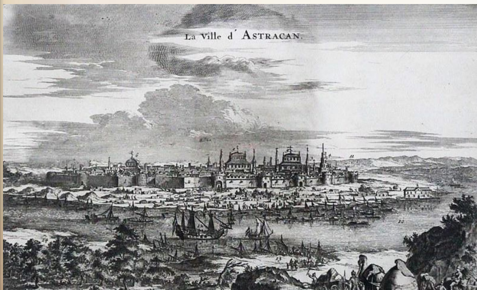
Вид города Астрахани и фрегата «Орёл» с флотилией. XVII век.

Государственный флаг в России появился на рубеже XVII-XVIII веков, в эпоху становления России как мощного государства. Впервые бело-сине-красный флаг был поднят на первом русском военном корабле «Орел», в царствование отца Петра I Алексея Михайловича. «Орел» недолго плавал под новым знаменем: спустившись по Волге до Астрахани, был там сожжен восставшими крестьянами Степана Разина. Законным же отцом триколора признан Петр I. 20 января 1705 года он издал указ, согласно которому «на торговых всяких судах» должны поднимать бело-сине-красный флаг, сам начертил образец и определил порядок горизонтальных полос.